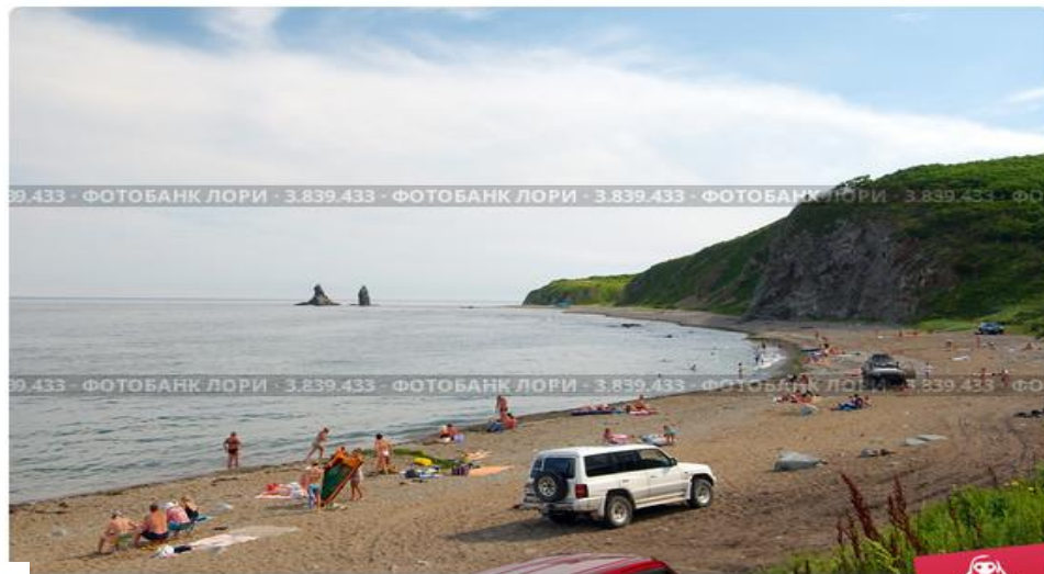
пляж, Дальний восток, Приморье