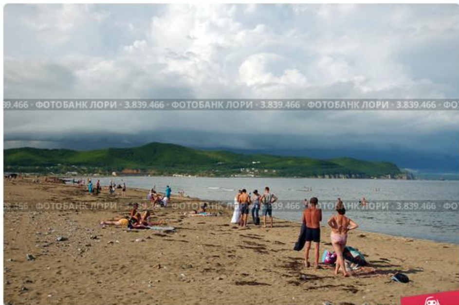
Пляж, Дальний восток, Приморье