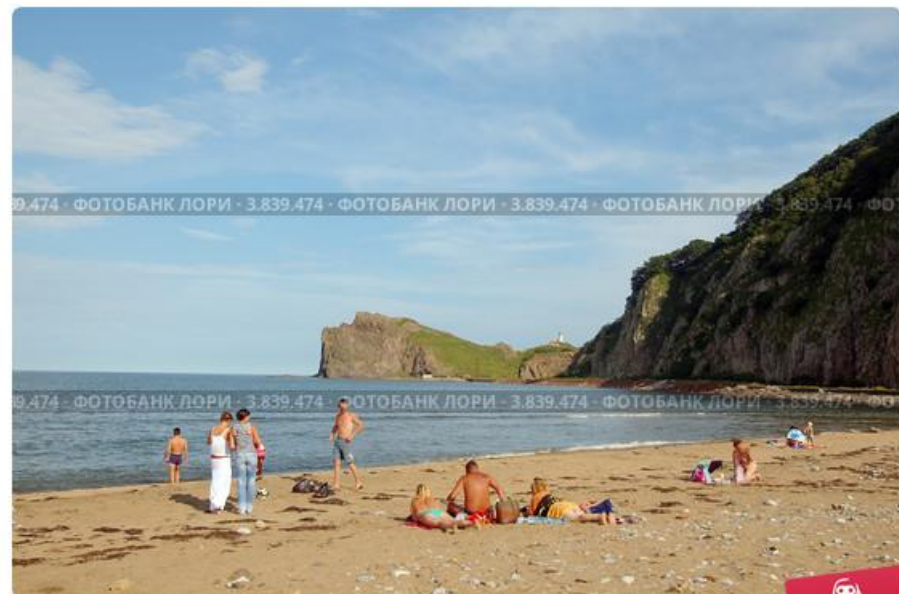
Пляж, Дальний восток, Приморье