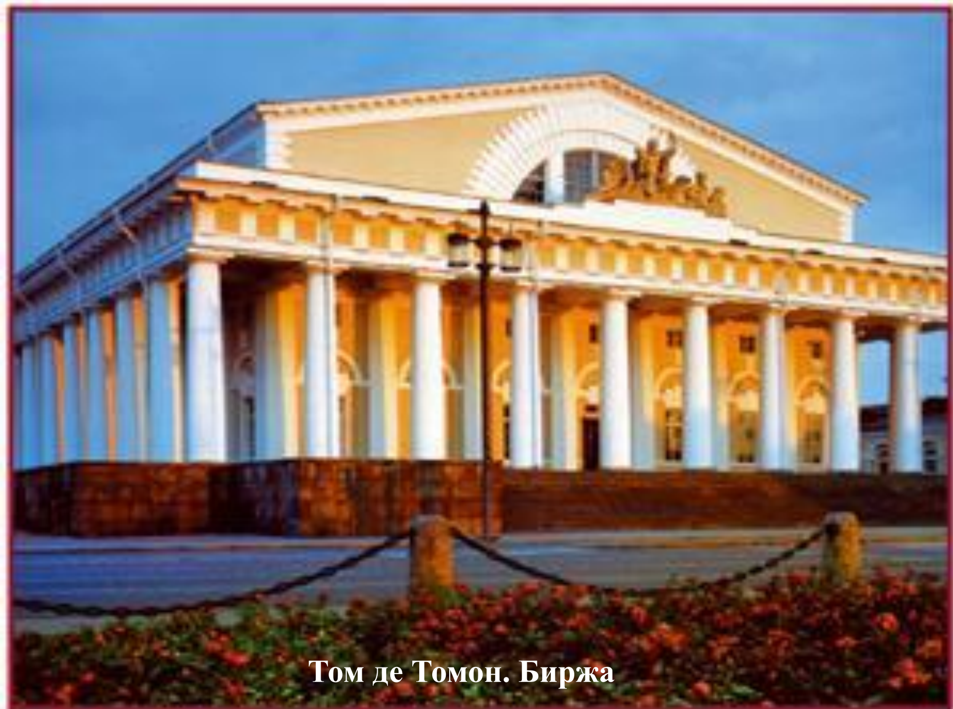
Том де Томон. Биржа