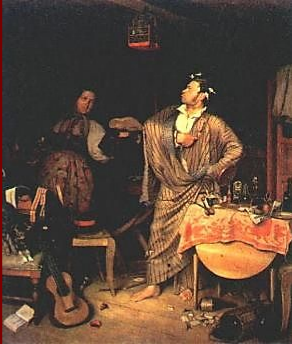
П.А.Федотов. Свежий кавалер.

Основоположником критического реализма в живописи стал П. Федотов, поднимавший в своих картинах социальные проблемы. В его «Свежем кавалере», чувствуется драматизм ситуации, критическое отношение автора к действительности и изображаемому герою.