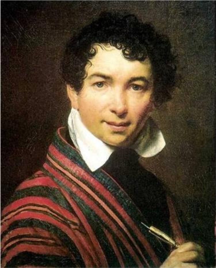
О. А. Кипренский. Автопортрет. 1828 г.