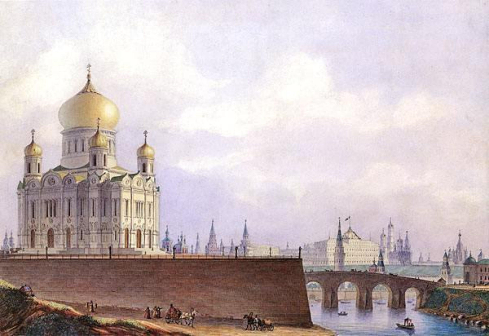
К.А.Тон. Храм Христа Спасителя