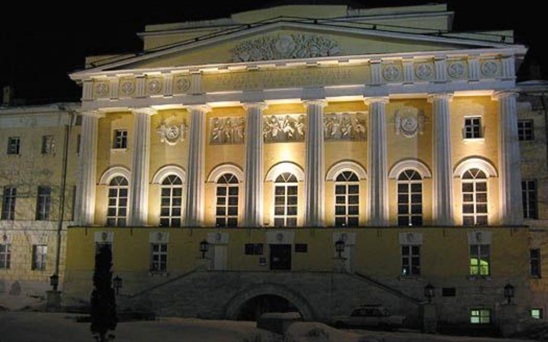
Д.Жиллярди. Здание МГУ