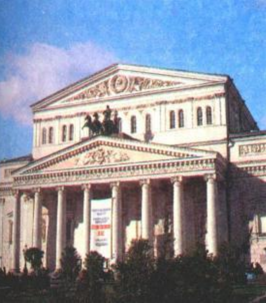
О.Бове Большой театр.

В Москве в стиле ампира выполнены работы О. Бове (реконструированная Красная площадь, Большой театр,) Д. Жилярди (здание Московского университета).