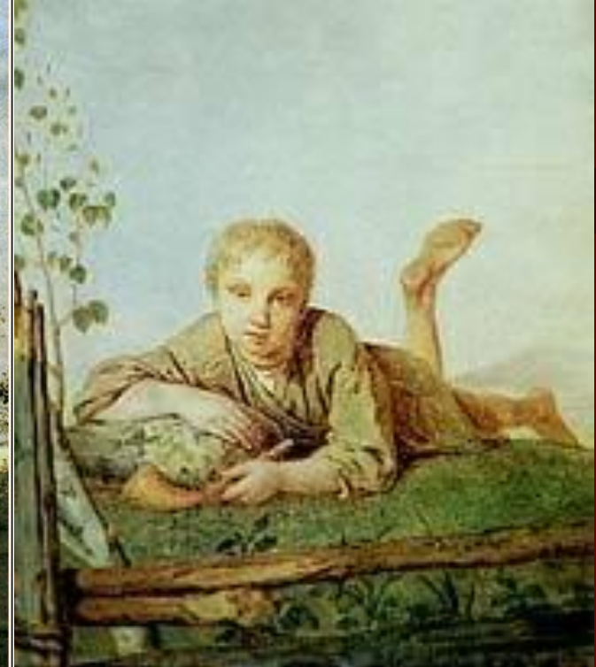
«Пастушок с дудкой». 1820-е годы.