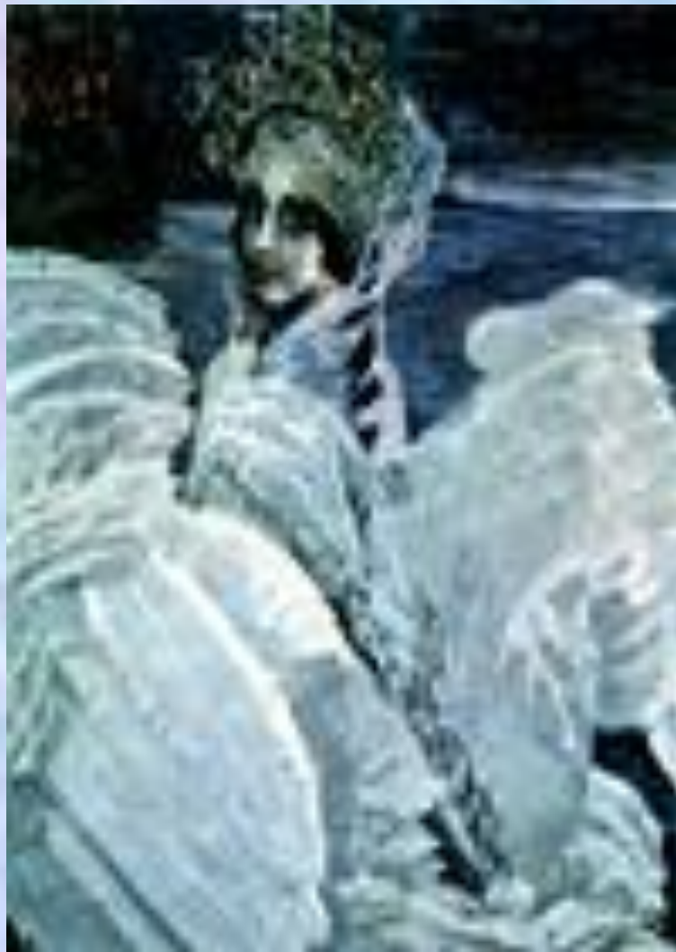
Михаил Врубель «Царевна-Лебедь»