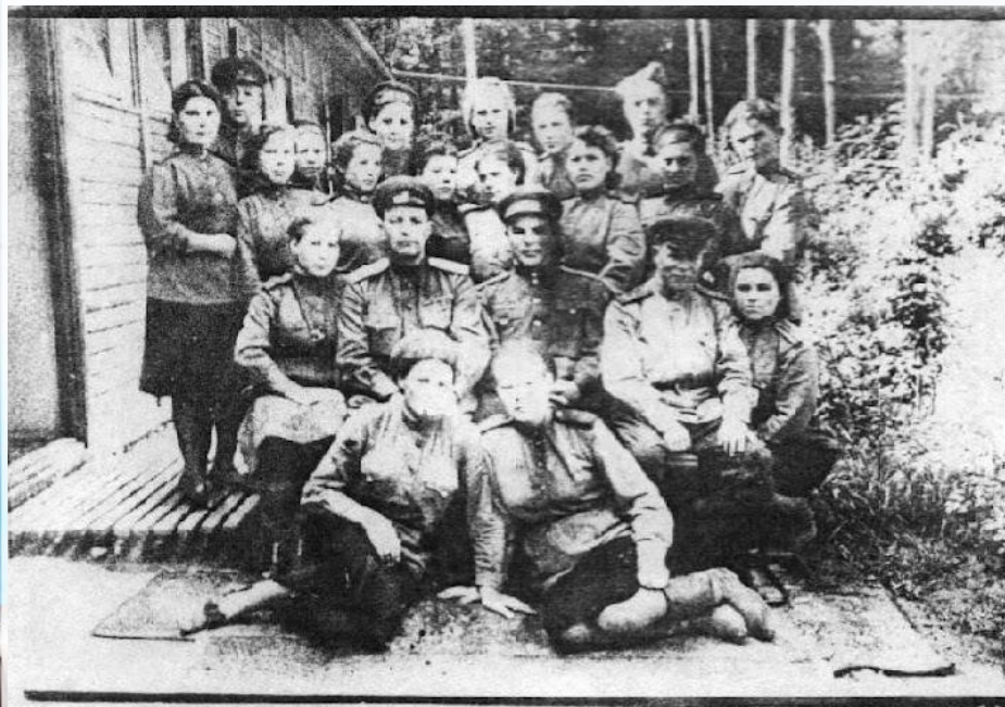
Королева П.Т.(справа)в первом ряду

Как на Северном фронте закончились военные действия, осенью, в сентябре 1943 года, перебросили на 2-й Белорусский фронт. Прибыли под Брянск, станция Палихи.