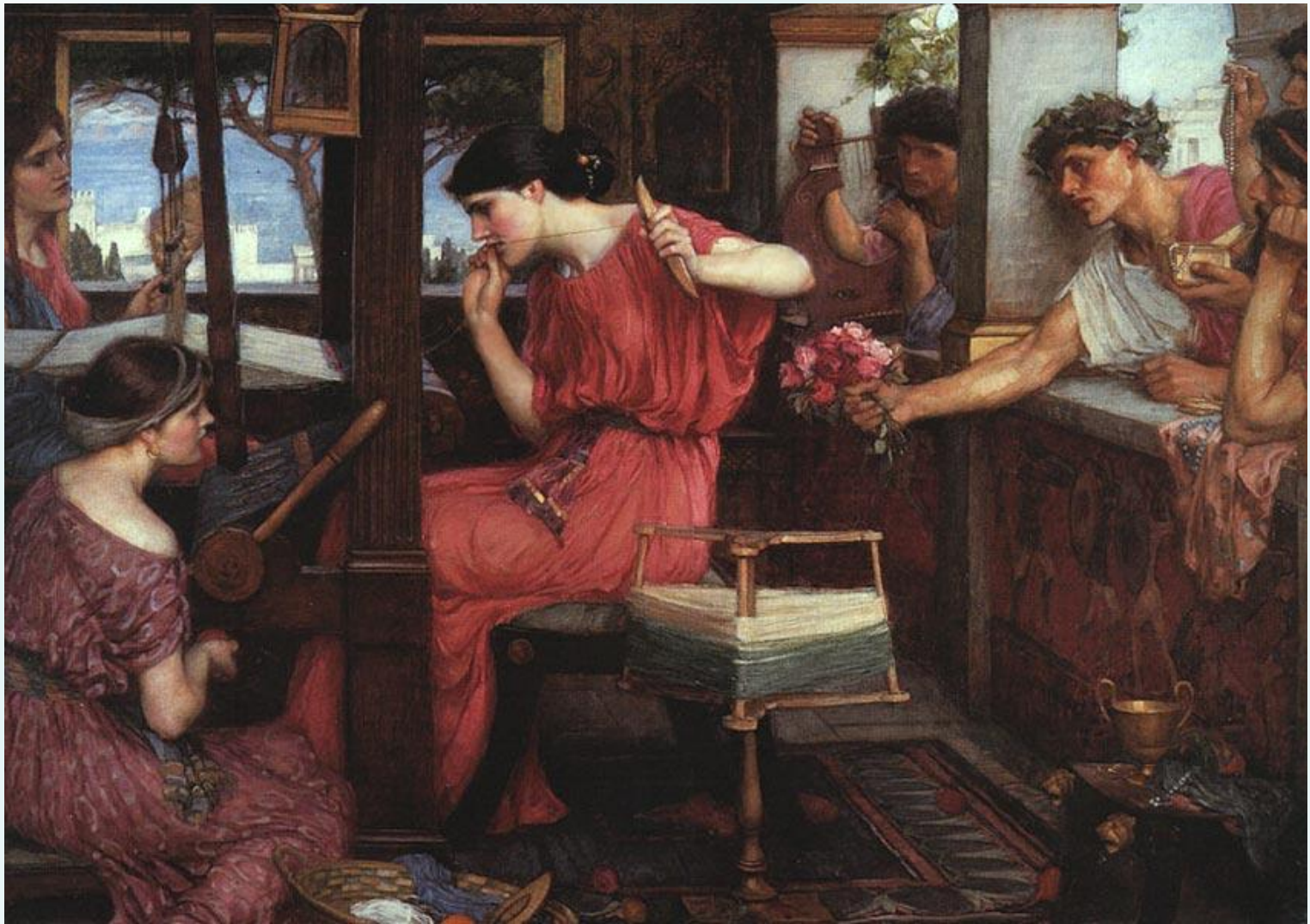
Пенелопа в ожидании Одиссея. Многие женихи пытались завоевать сердце красавицы Пенелопы.