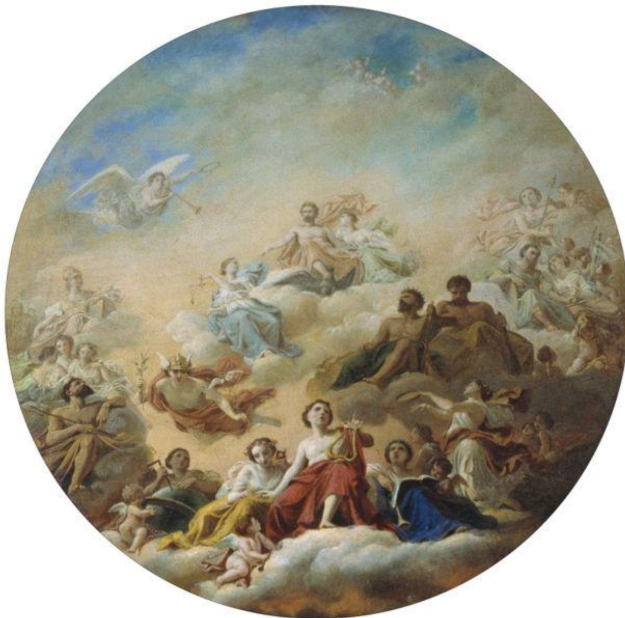
Высоко на светлом Олимпе царит Зевс, окруженный сонмом богов.