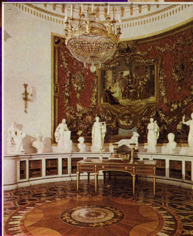
Библиотека Марии Федоровны