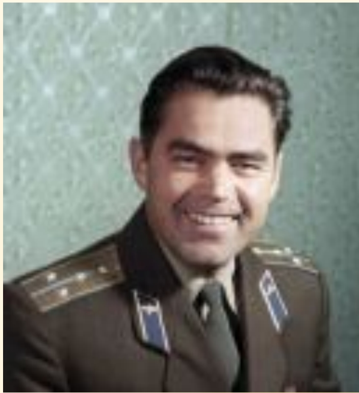
1951 ҫулта Фрунзери ҫар авиаци летчикёсен училищинче вёренме пуҫланă

... Андриян летчика вёренет, Хайёнчен хай йалтах тёлёнет: Ҫутă ёмёт кёрет пурнăҫа — Аҫта хурăн чунри савнăҫа!