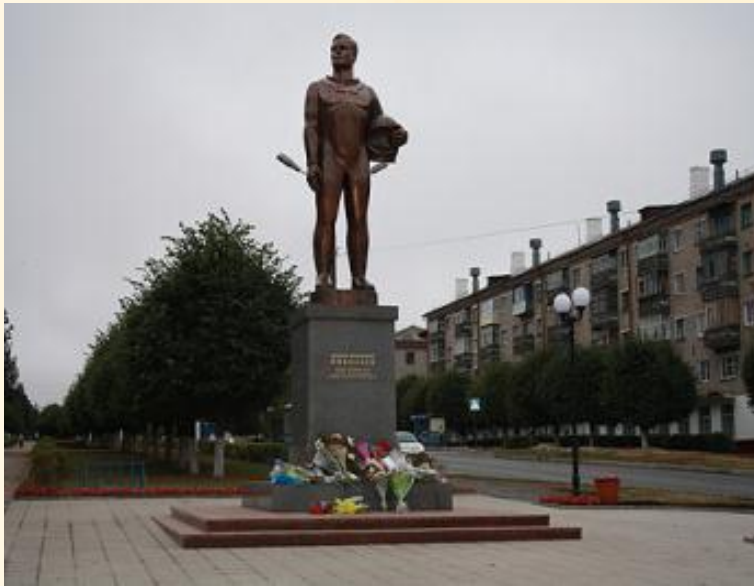
Шупашкар хулинчи палӑк