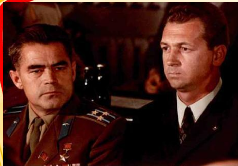
Николаевпа Севастьянов вёсєв хысқан

Вёсєвё 17 талак та 16 сехет те 58 минут та 55 секунд пынă