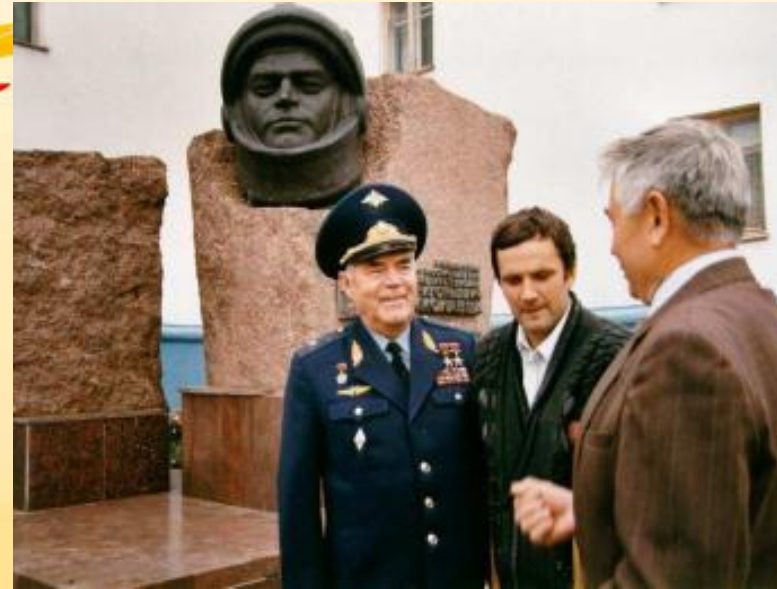
А.Николаев хайӑн ячӑпе лартнӑ палӑк умӑнче

Шупашкар урамӑнче Космонавт шлемӑпе Николаев хай тӑрать, Тавралӑха тинкерет.