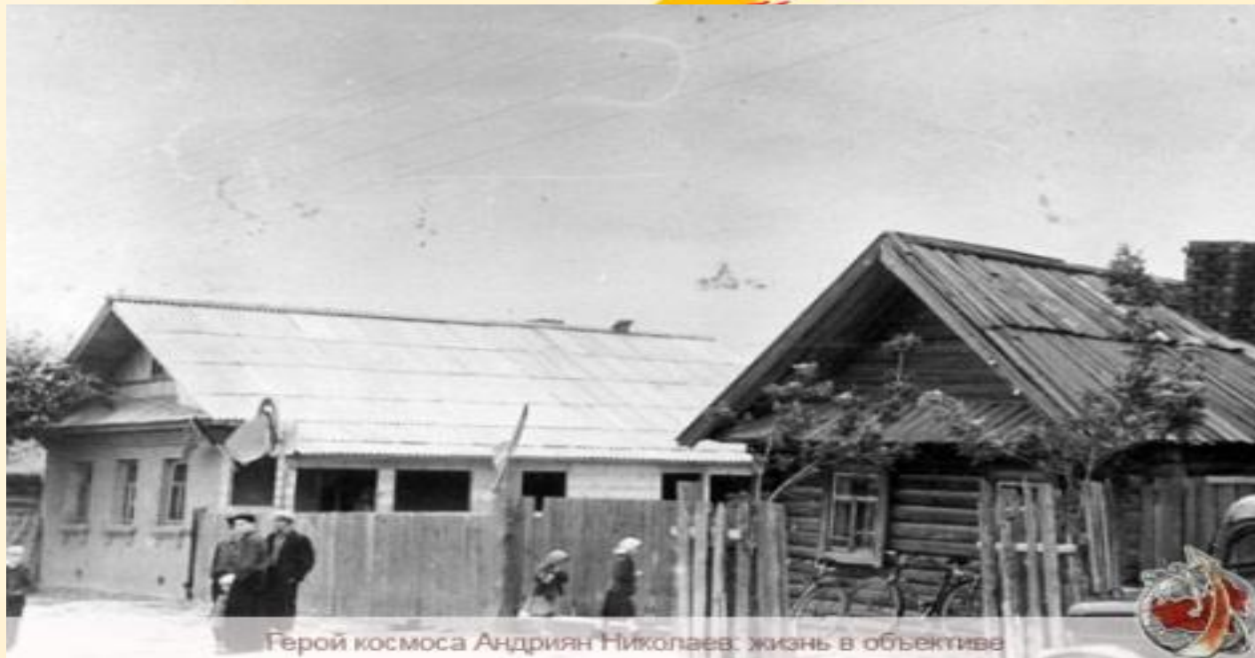
Герой космоса Андриян Николаев: жизнь в объективе