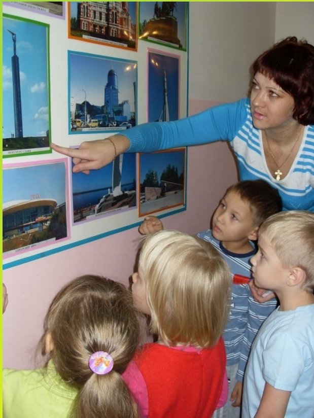
Знакомство с достопримечатель- ностями города