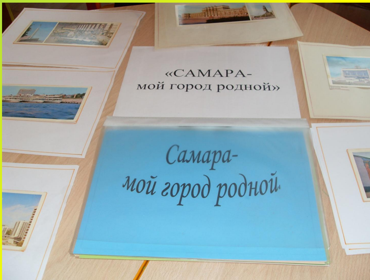
Создание альбома «Самара - мой город родной»