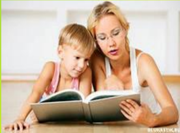
Информация от родителей