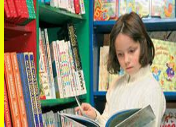
Поход в библиотеку, чтение литературы