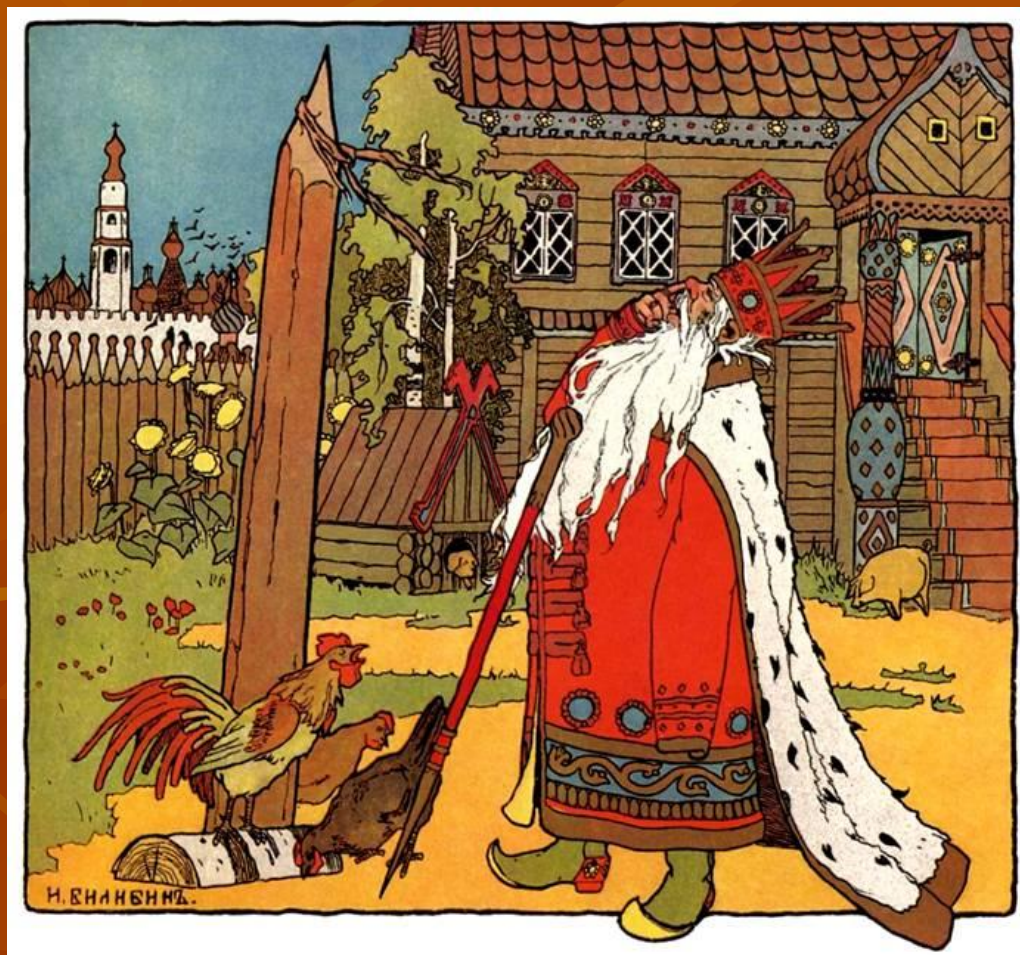
«Царевна - лягушка»