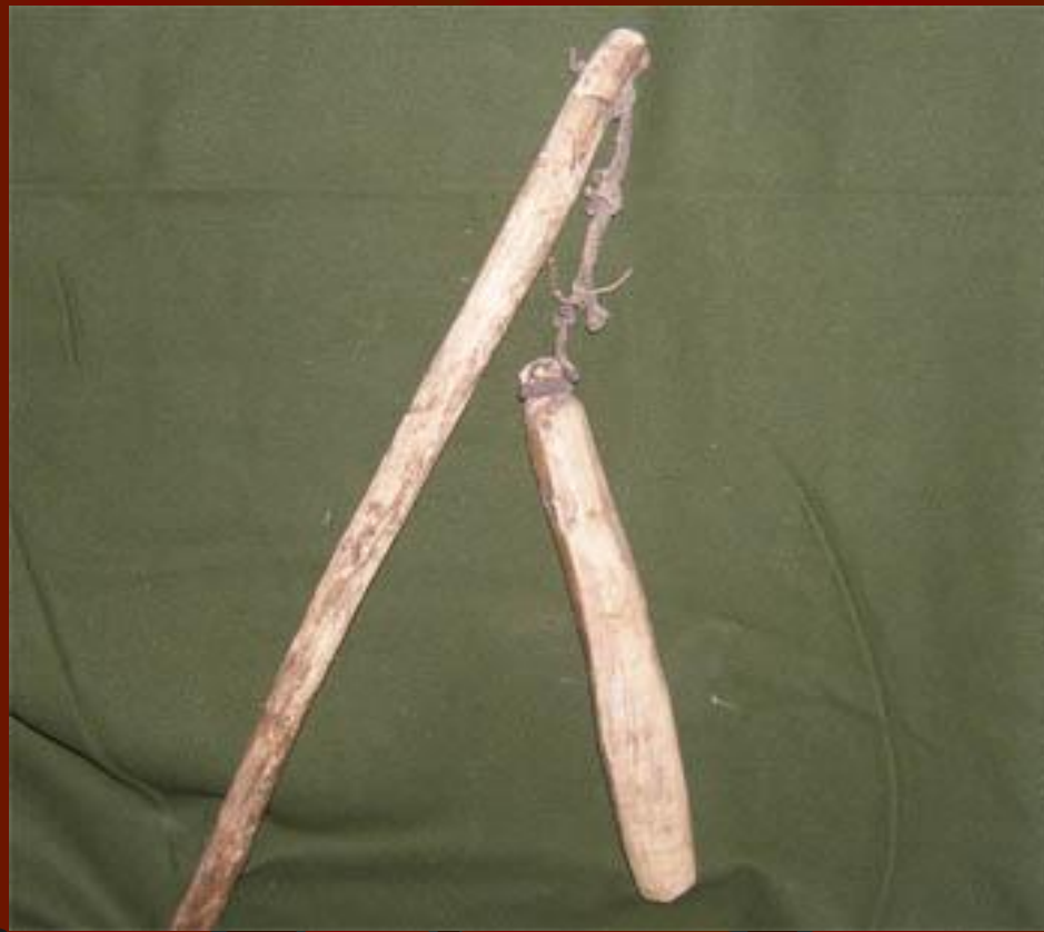
Цеп для обмолачивания зерна