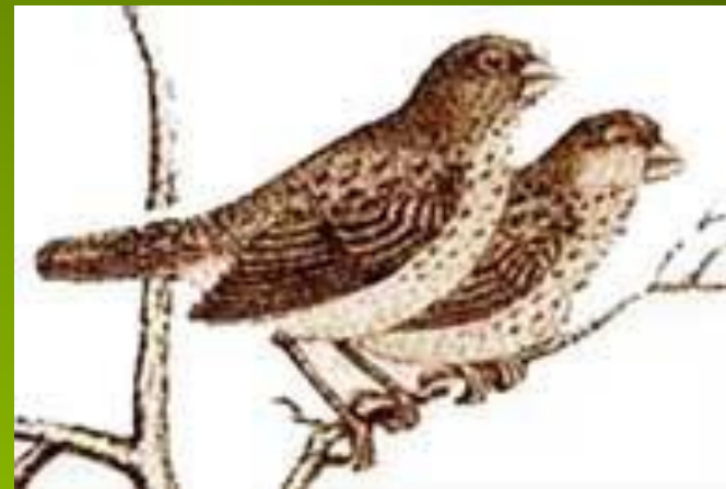
Толстоклювый древесный вьюрок