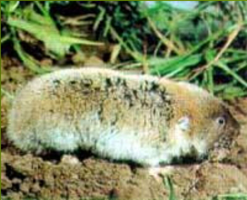
Слепушонка Ellobius talpinus