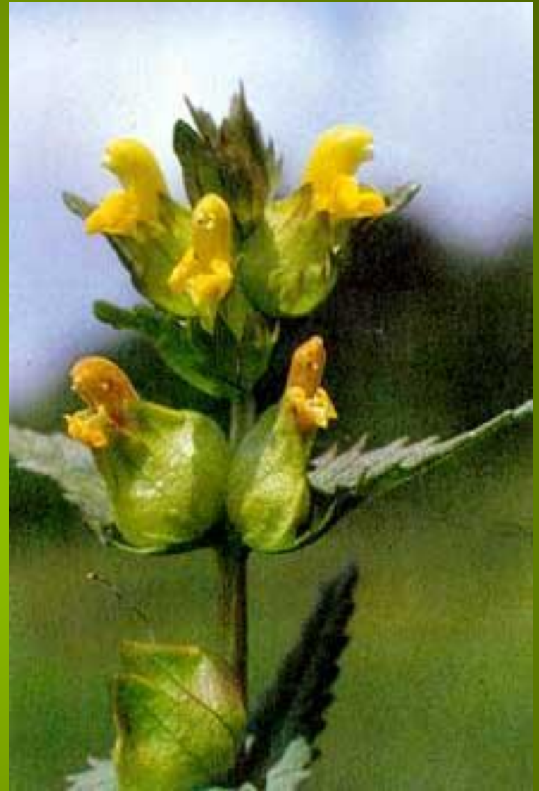
Большой погремок Alectorophus major