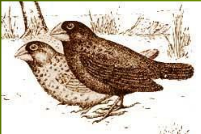
Большой земляной вьюрок