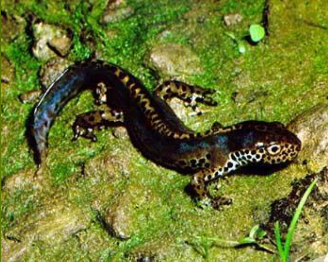
Тигровая саламандра Ambystoma sp.