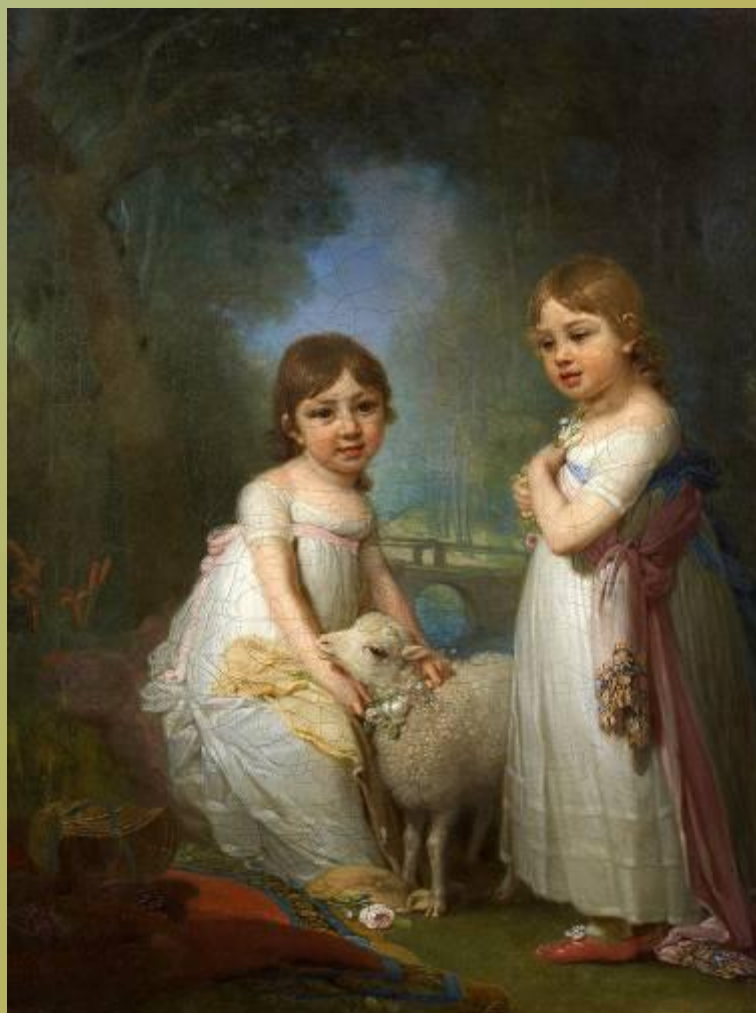
Дети с барашком