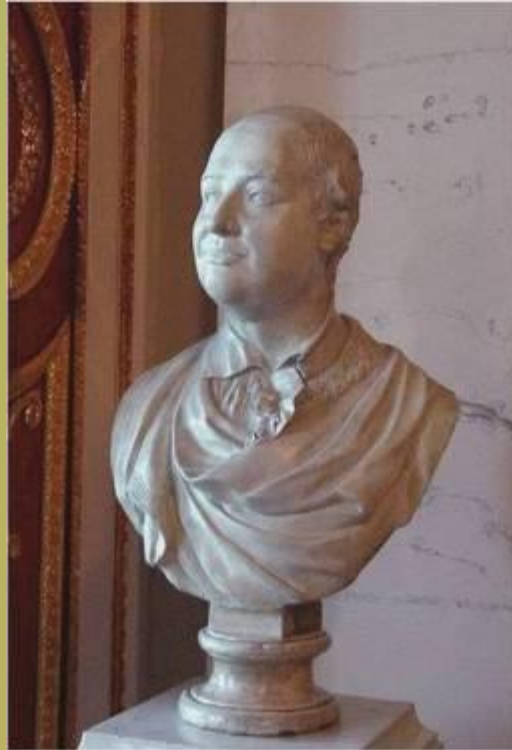
Портрет М.В. Ломоносова