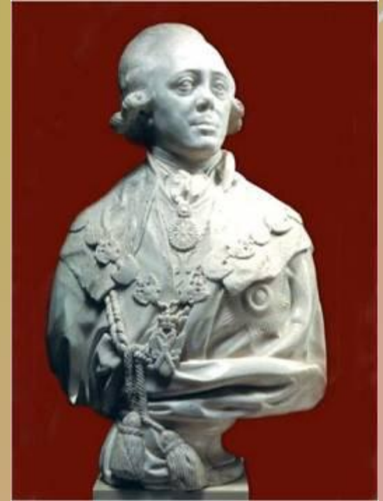
Портрет императора Павла I