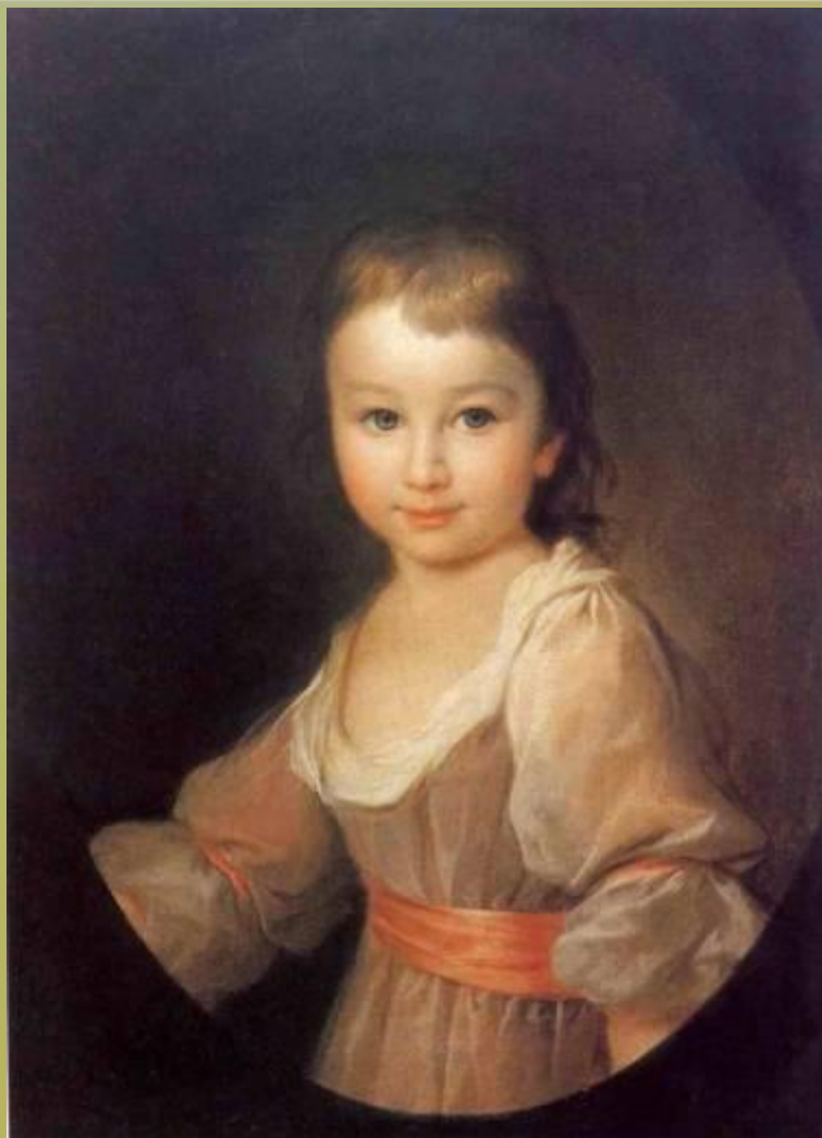
Портрет Прасковьи Артемьевны Воронцовой в детстве