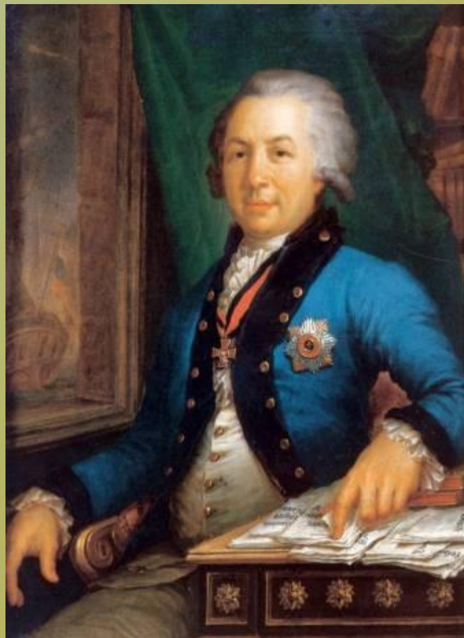
Портрет Г.Р.Державина. (художник В.Л.Боровиковский)

Гавриил Романович Державин (1743-1816) – известный поэт того времени