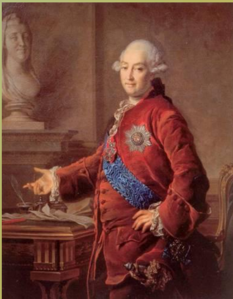
Портрет вице- канцлера князя Александра Михайловича Голицына