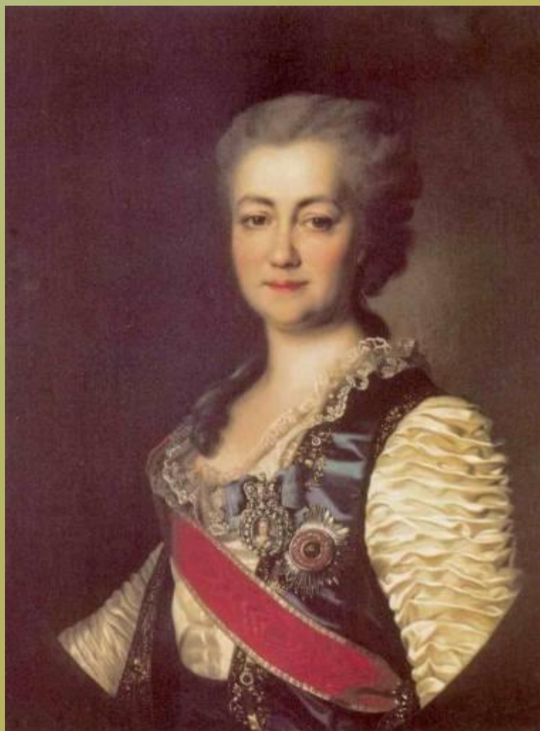
Портрет Екатерины Романовны Дашковой