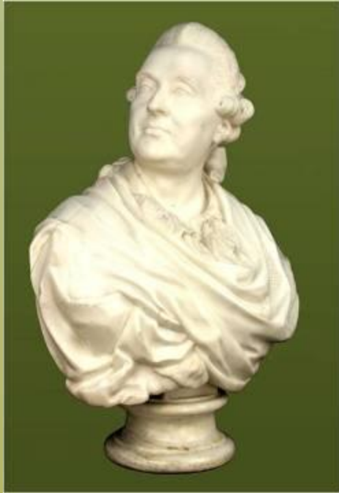
Портрет князя А. М.Голицына