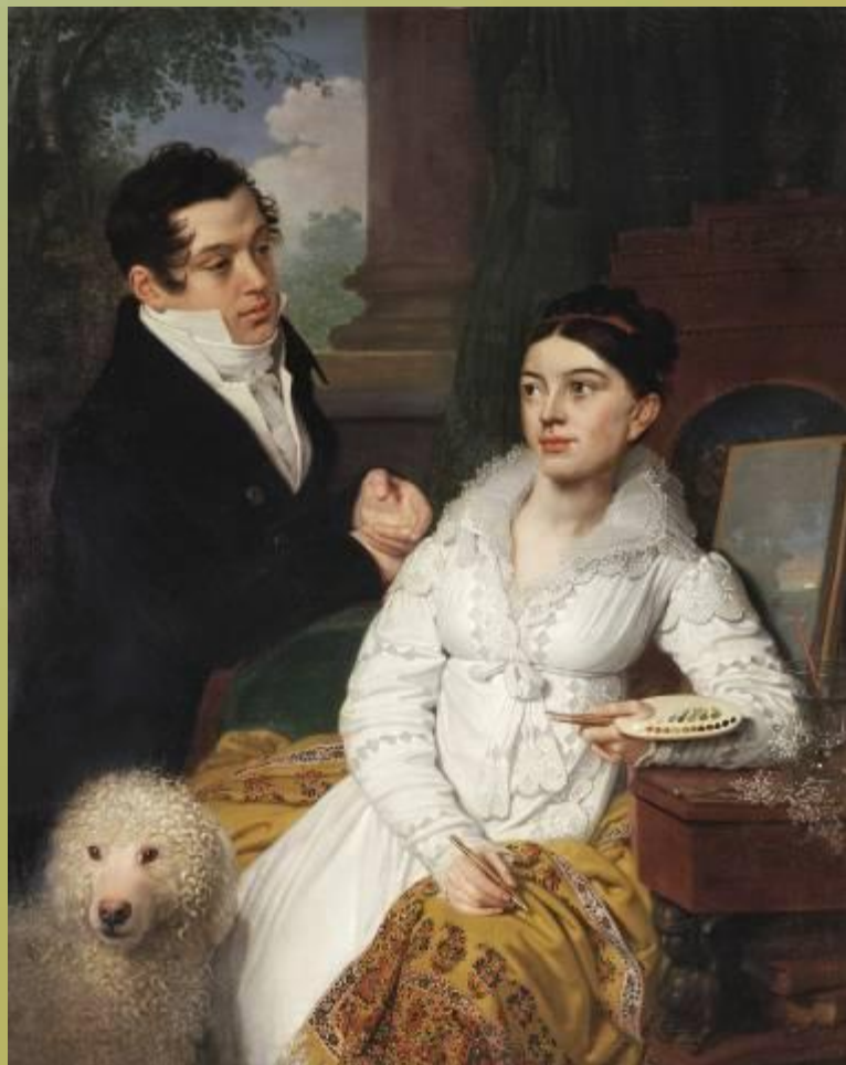
Портрет князей Алексея Александровича и Александры Григорьевны Лобановых-Ростовских.