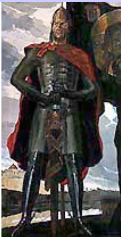
П. Д. Корин «Александр Невский»