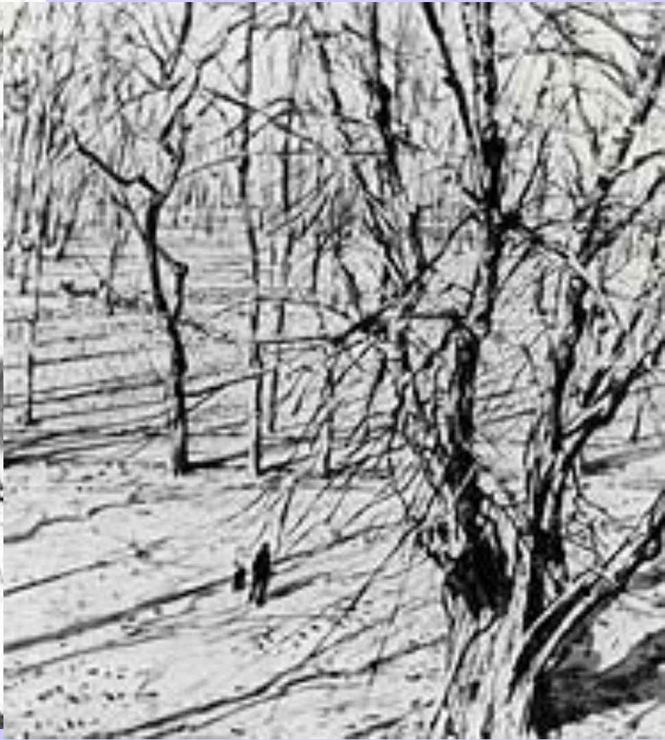
Г. С. Верейский.

Иллюстрация к роману А. Н. Толстого «В саду Русского музея. Ленинград». «Петр I».