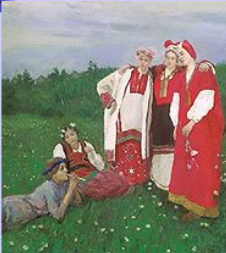
К.А. Коровин. Северная идиллия.