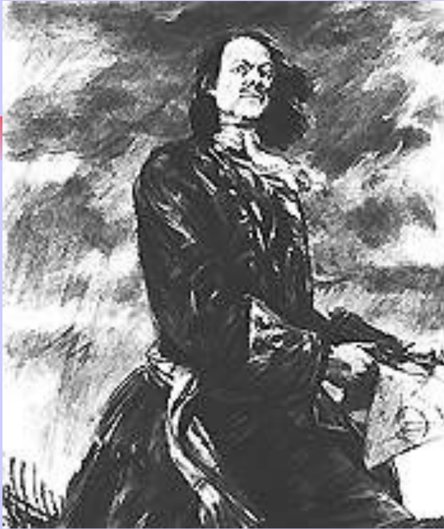
Д. А. Шмаринов.