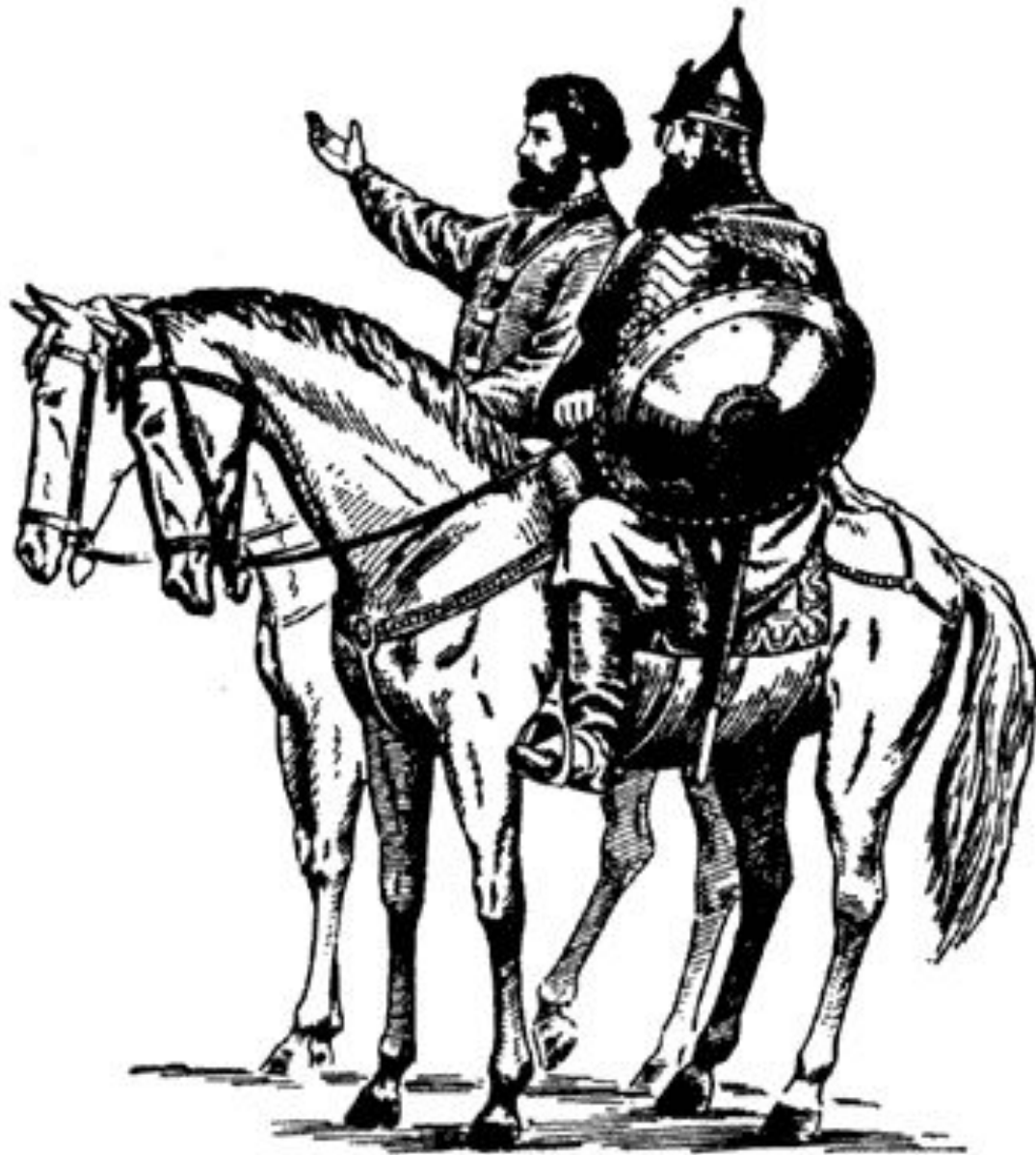
Дмитрий Пожарский и Кузьма Минин