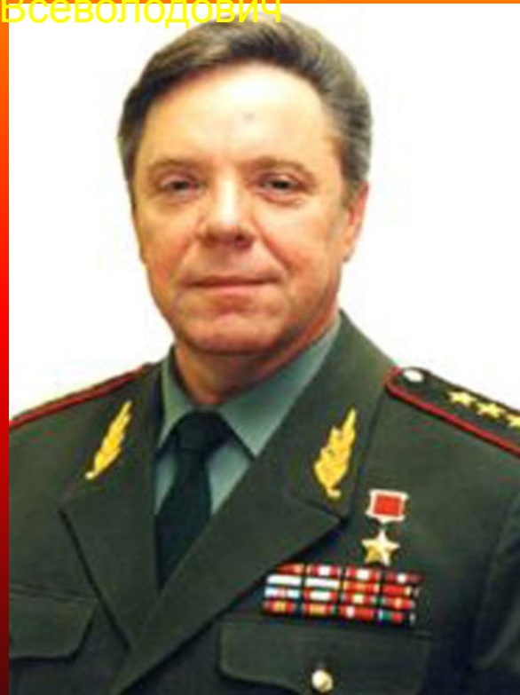
Громов Борис Всеволодович

После ухода советских войск из Афганистана существенно осложнилась обстановка на советско-афганской границе: имели место обстрелы территории СССР, попытки проникновения на территорию СССР (только в 1989 году имели место около 250 попыток проникновения на территорию СССР), вооружённые нападения на советских пограничников, минирование советской территории (в период до 9 мая 1990 года пограничниками были сняты 17 мин: английские Mk.3, американские M-19, итальянские TS-2,5 и TS-6,0