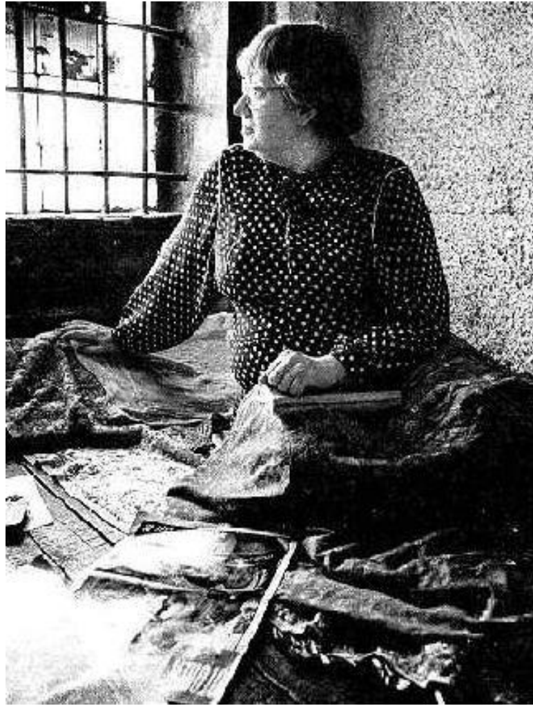
В.Новодворская в тюрьме.

Солженицын выступал за возрождение национального государства.