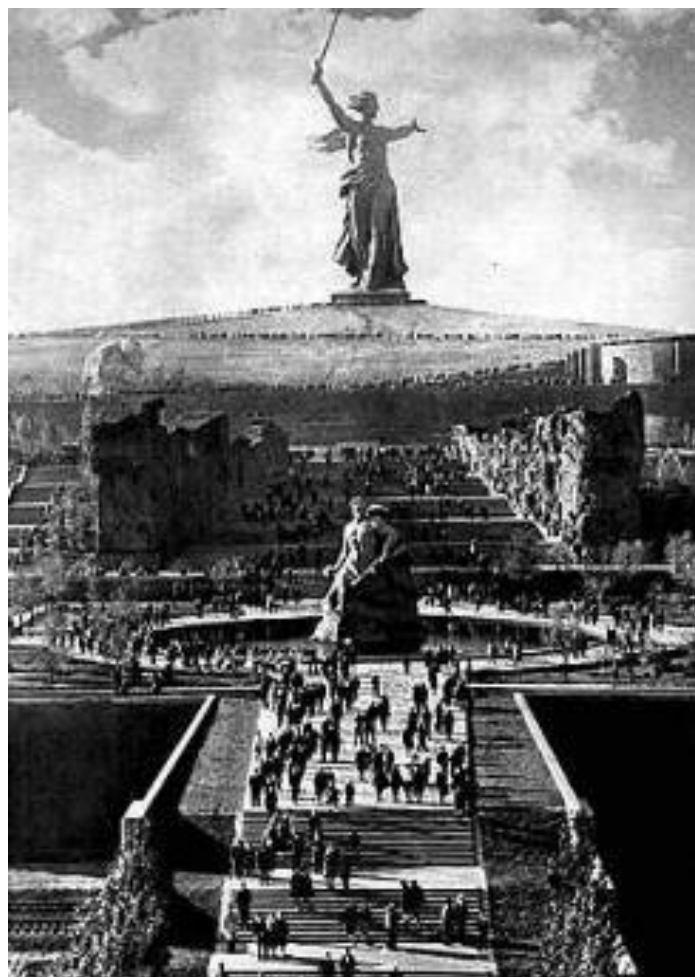
В.Вучетич. Комплекс на Мамаевом кургане.