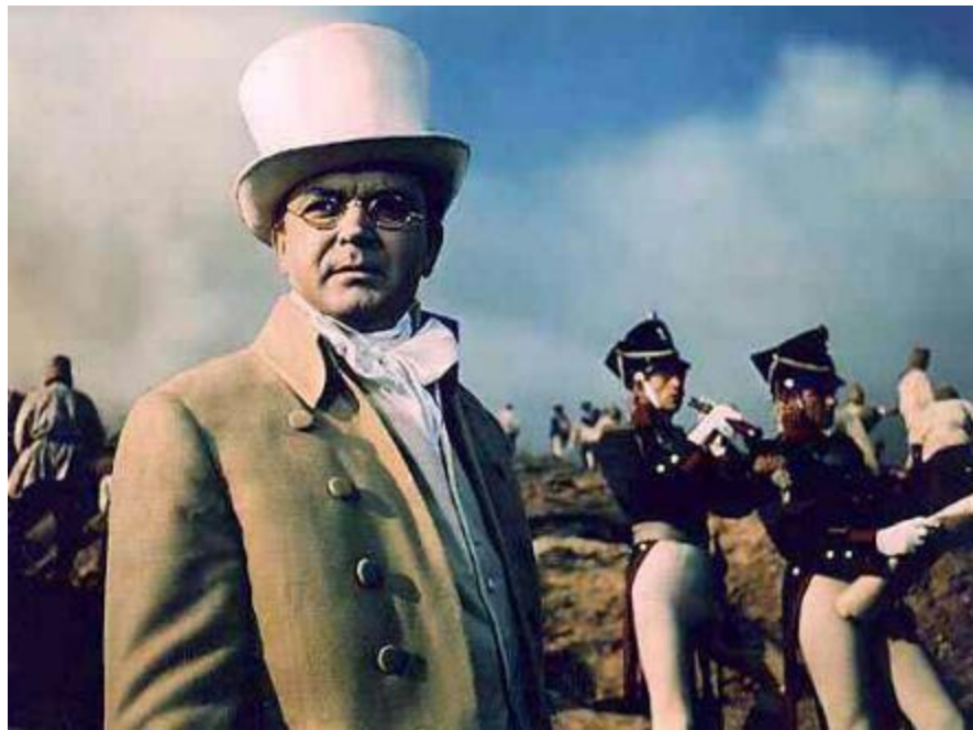
С.Бондарчук в роли П. Безухова.

Власти требовали от деятелей культуры «золотой середины»-отказа от «очернительства» и от «лакирования действительности». Предписывалось создавать произведения на производственную тематику с положительным героем-партийным руководителем. В кинематографе на этот период пришелся расцвет творчества С. Бондарчука, Ю. Озерова, Т. Лиозновой, А.Тарковского, Э.Рязанова, Л.Гайдая и др.