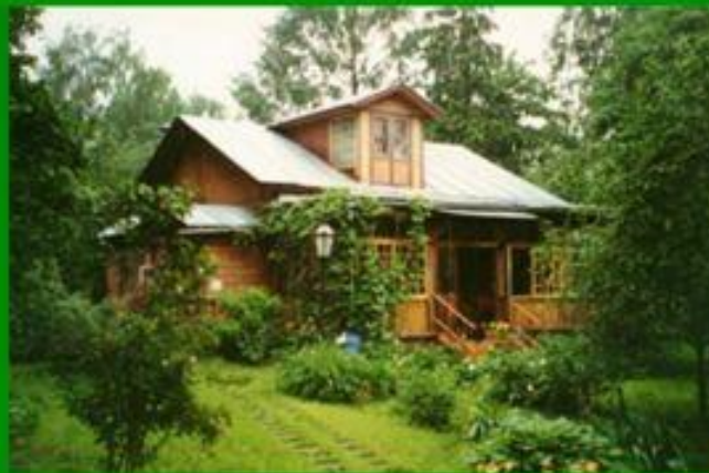
Дом в Комаровке

русский советский поэт, детский писатель, переводчик, популяризатор мировой детской классики