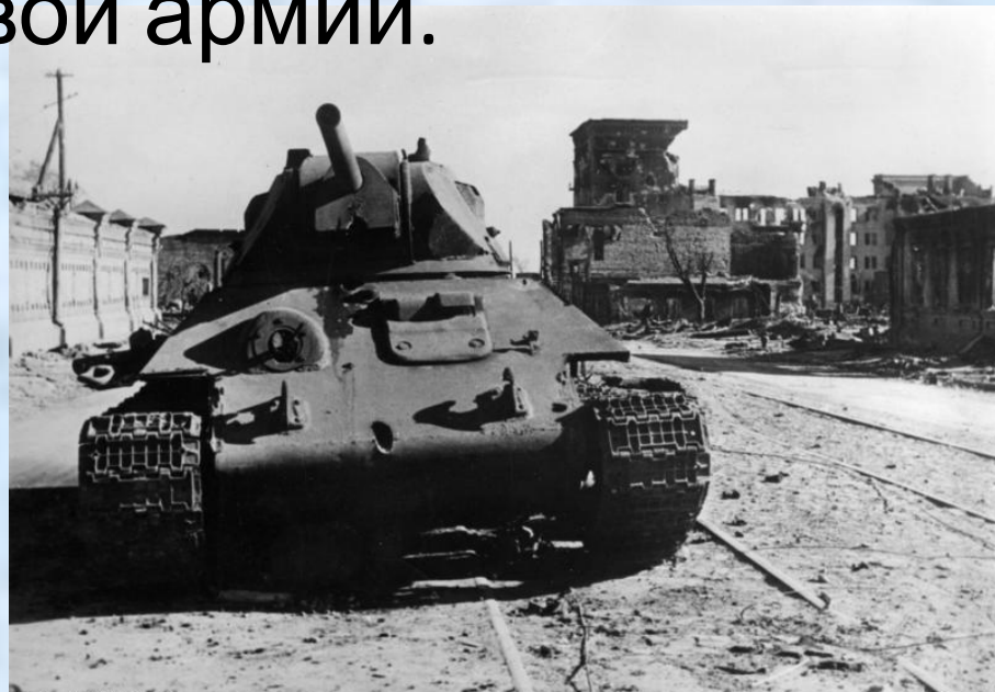
Bundesarchiv, Bild 183-B22359 Foto: Herber | Oktober 1942