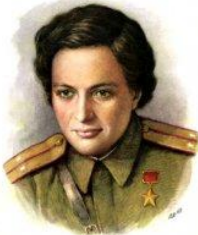
Герой Советского Союза ЛЮДМИЛА МИХАЙЛОВНА ПАВЛИЧЕНКО