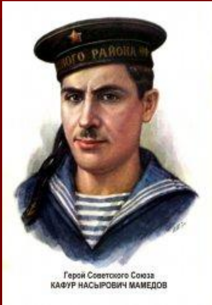
Герой Советского Союза КАФУР НАСЫРОВИЧ МАМЕДОВ