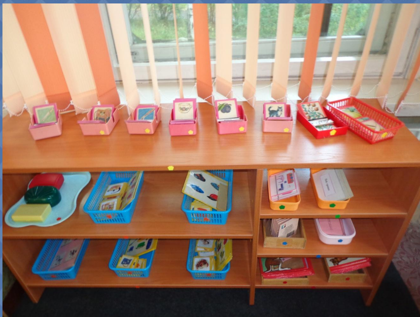
Зона русского языка