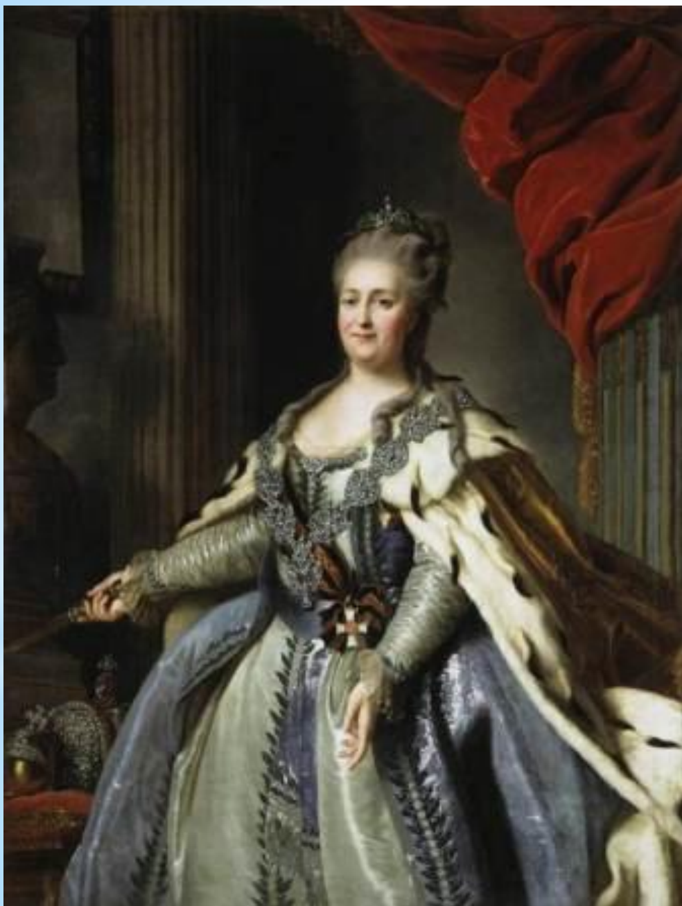
Екатерина II с орденом Святого Великомученика и Победоносца Георгия