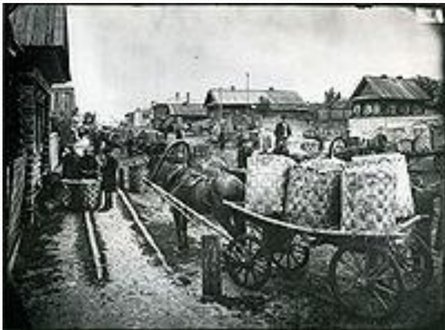
Ложкарный базар в Семёнове. Начало XX века.