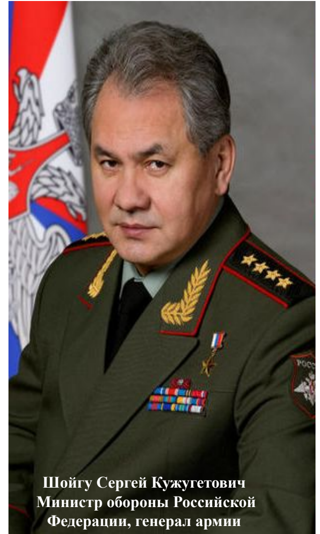
Шойгу Сергей Кужугетович Министр обороны Российской Федерации, генерал армии

Непосредственное руководство ВС РФ осуществляет Министр обороны РФ через Министерство обороны. Министерство обороны реализует политику в области строительства ВС РФ в соответствии с решениями высших органов государственной власти Российской Федерации.