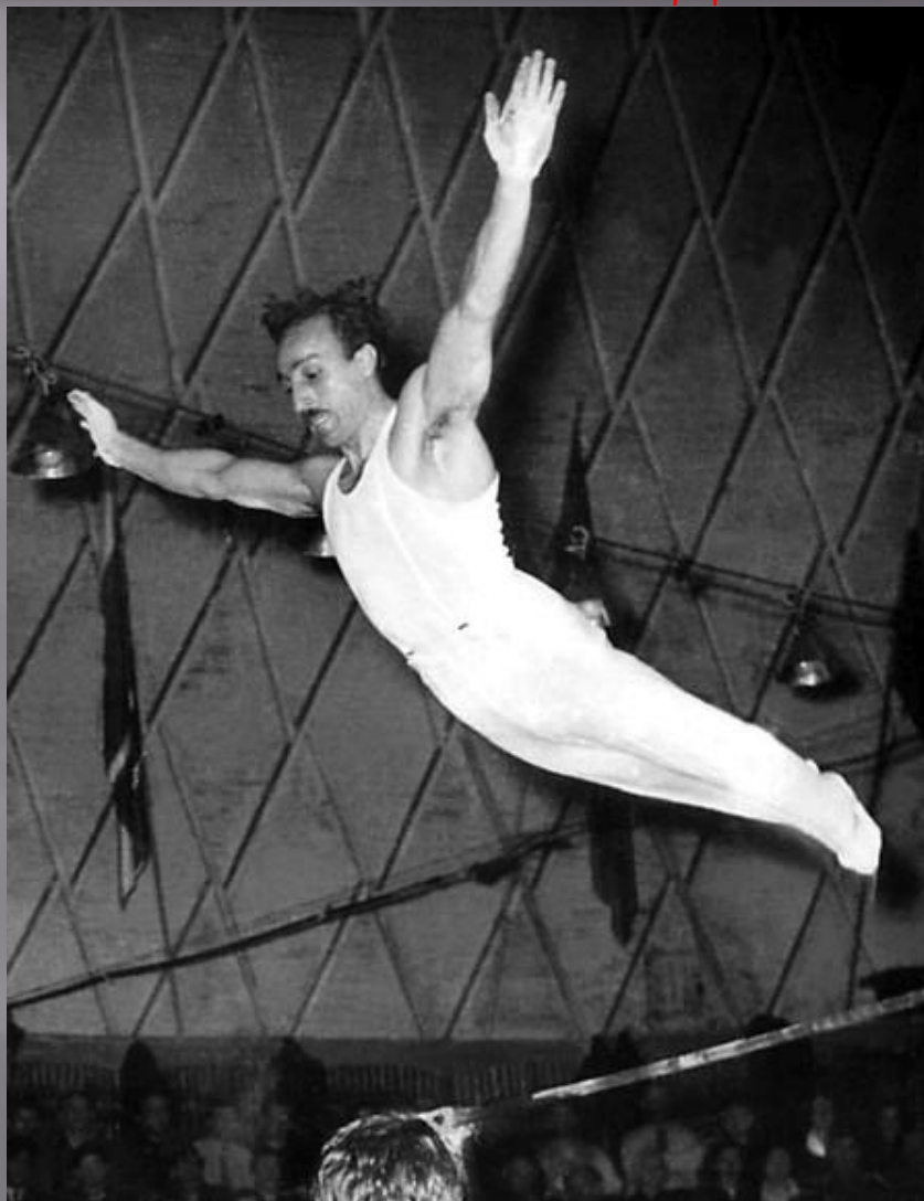
Армянский гимнаст Грант Шагинян.