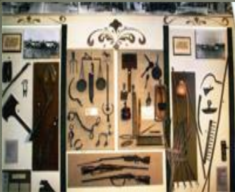
Экспозиция «Промыслы и ремесла на Кубани»