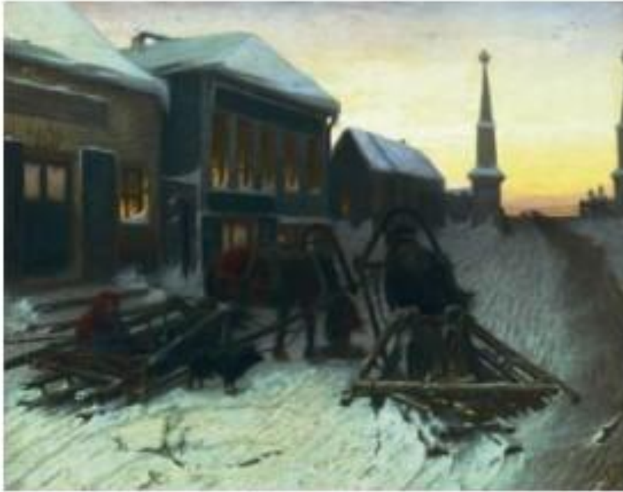
В. Перов. Последний кабаk у заставы