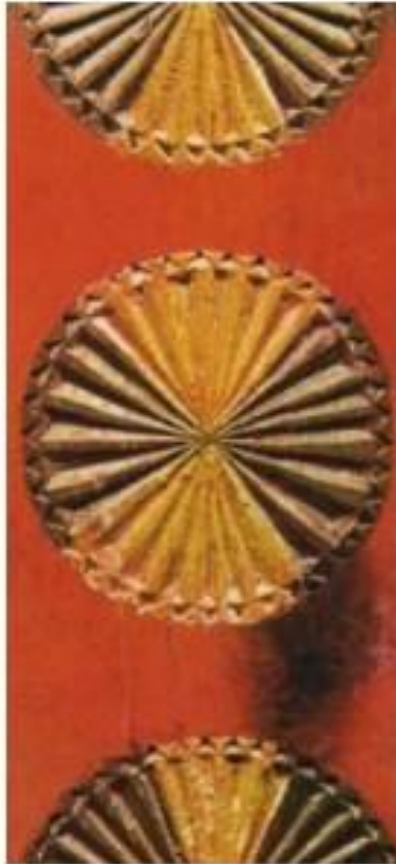
Фрагмент прялки с солярными знаками. Архангельская губерния. Конец XIX в.