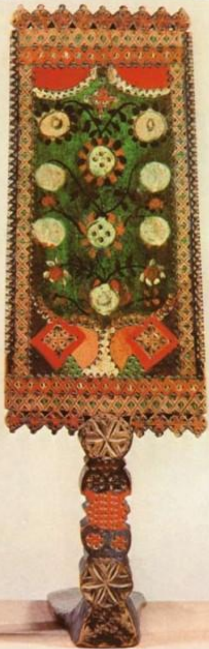
Прялка. Архангельская губерния. Конец XIX в.