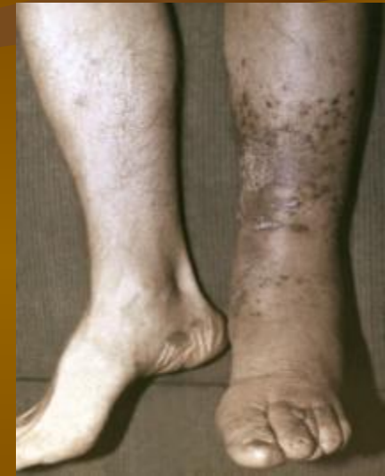
Саркома Капоши у больного СПИДом