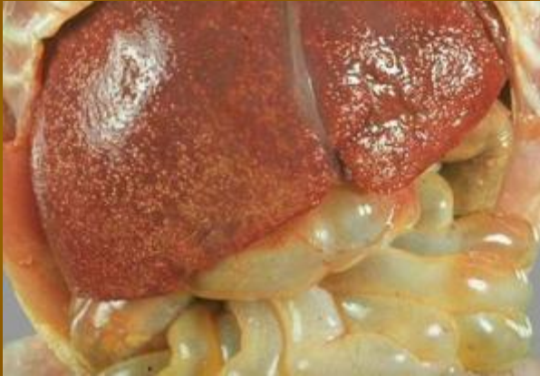
Абсцесс у больного печени СПИДом

В теле человека находят злокачественные опухоли – саркому Капоши и лимфому мозга.