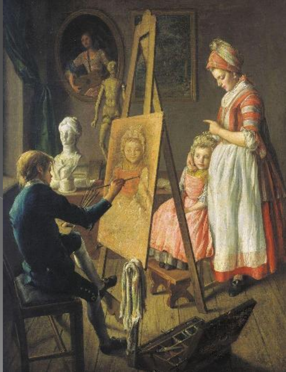
И. Фирсов. Юный живописец.

И под ней оказалась другая, « I. Firsove » - «И.Фирсов»