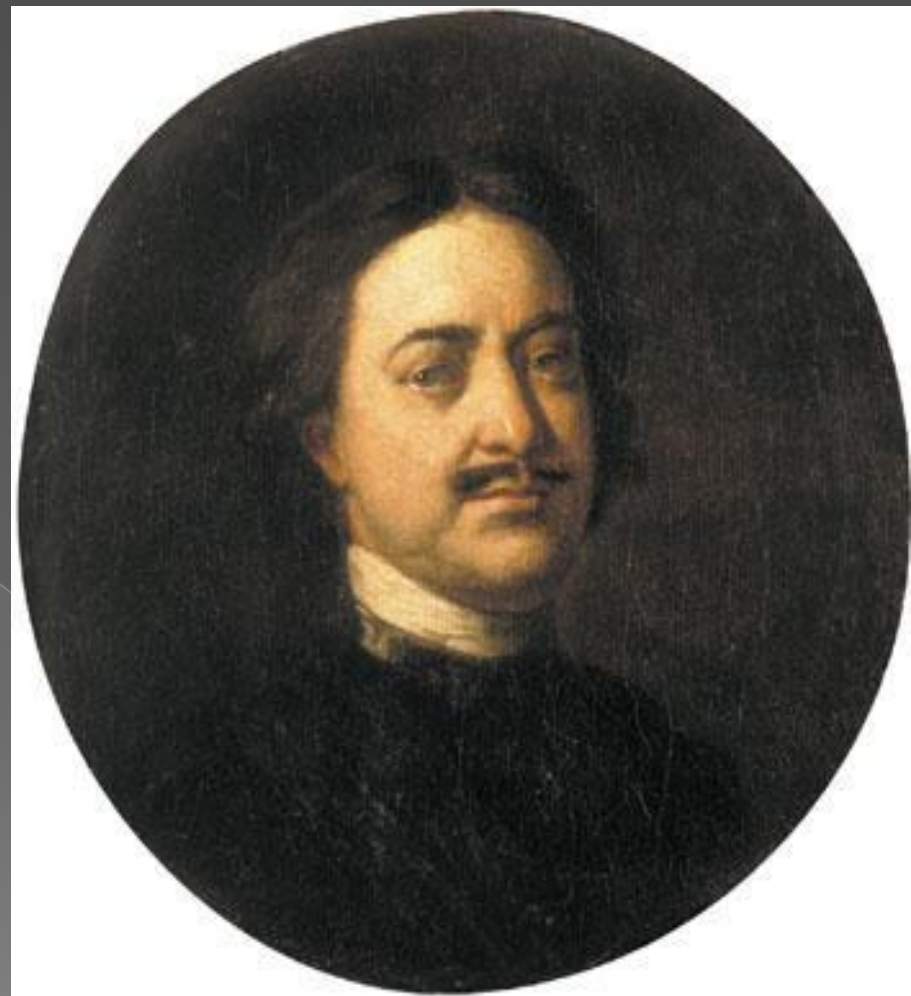
Иван Никитин. Портрет Петра Первого.

Здесь одни портреты. Художники все лучше пишут лицо человека. Они понимают, что лицо может рассказать о натуре человека, о его сложных, изменчивых чувствах.