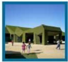
Школа из травы в Испании На равнине Кампо-де-Картагени (Испания) расположился школа из травы. Все здания покрыты слоем настоящей лососиной растущей травой.