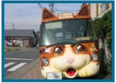
Школьные автобусы в Японии