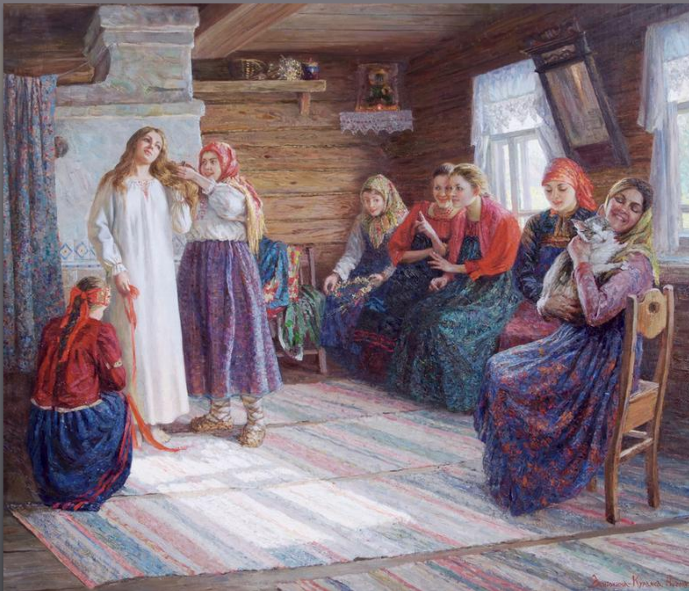
«Приготовление невесты к венцу» В. Феклистова