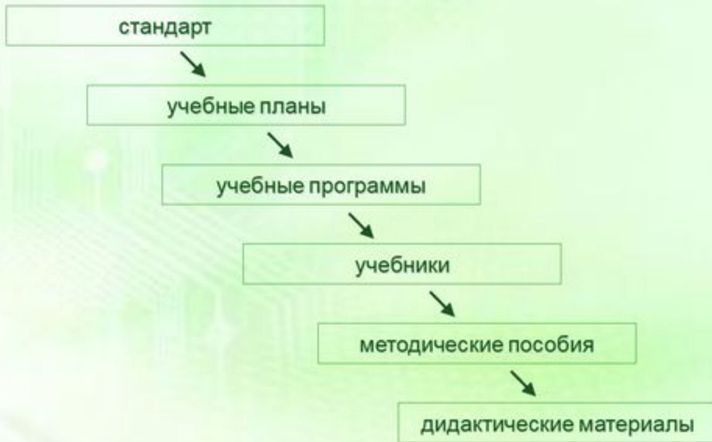
Рис. 2. Модель содержания образования (после 1992 г.).