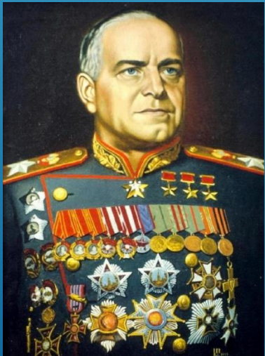
Жуков Г. К.