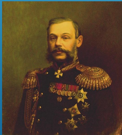
Милютин Дмитрий Алексеевич

Суть и основные моменты: замена рекрутства на "призывную" систему комплектования, создание военных округов (15 на то время), перевооружение армии новыми видами вооружений (нарезное стрелковое оружие и артиллерия), замена военных школ на юнкерские училища и военные гимназии, изменение военно-судебной системы. Срок службы с пожизненной снижен до 15 лет.