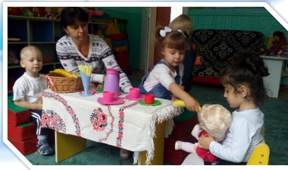
«Угостим куклу Катю фруктами»