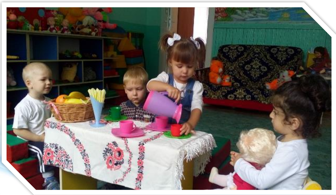
«Угостим куклу Катю чаем»