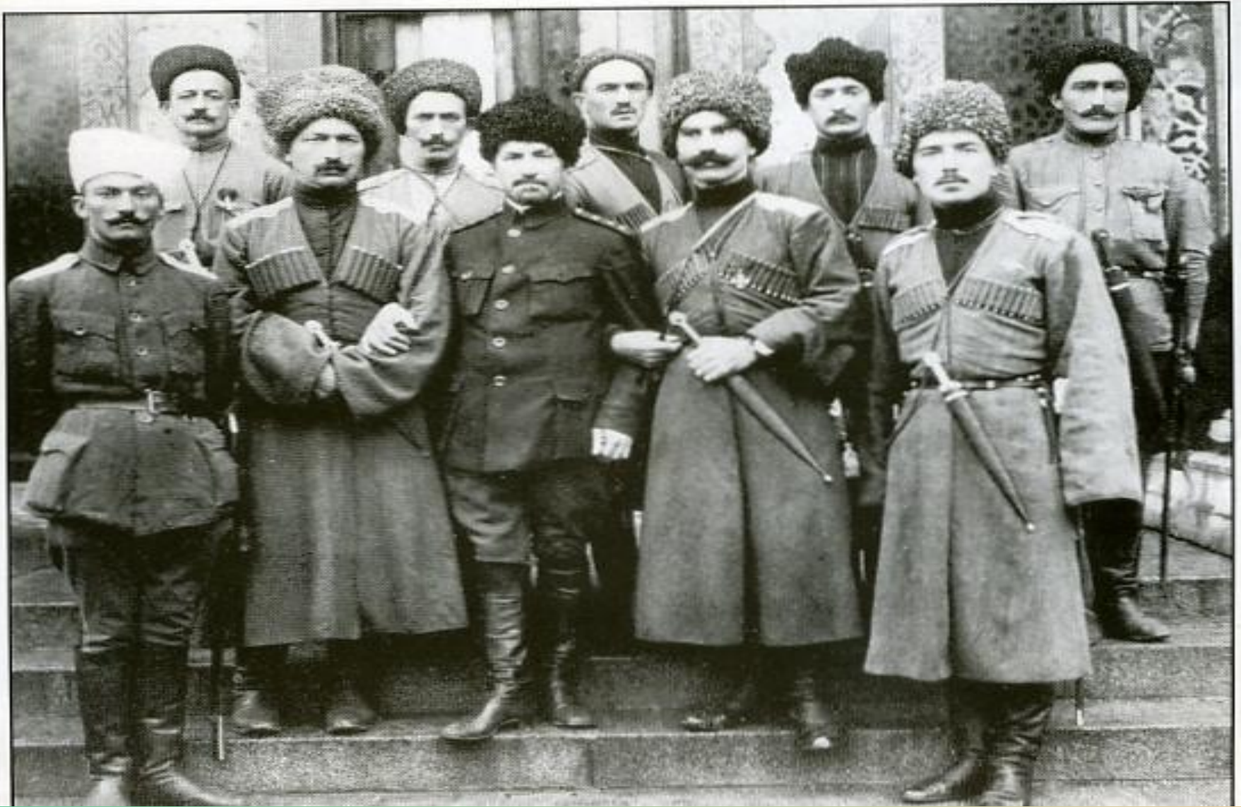
Горцы из «Дикой дивизии» с генералом Корниловым