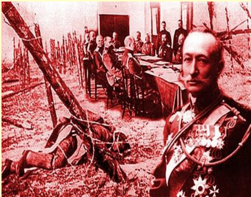
На марше и в часы затишья