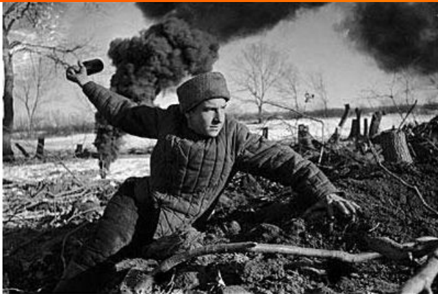
Сталинградская битва. Сентябрь 1942 года.

В степях под Сталинградом развернулось грандиозное сражение, в котором с обеих сторон участвовали свыше 2 миллионов человек.