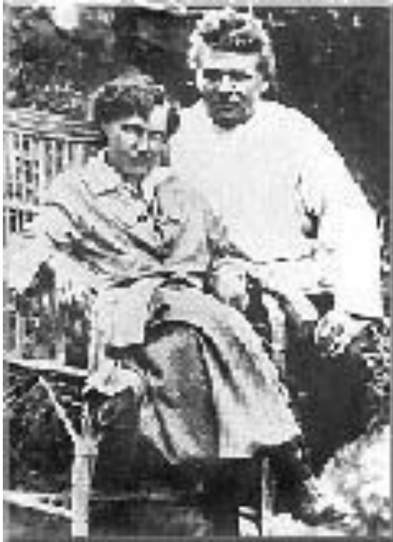
С.Т.и В.Н. Шацкие (начало 30-х гг. XX в.)