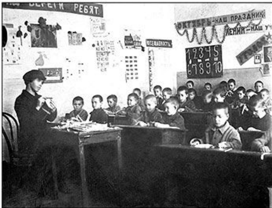
Урок в Елатомской единой трудовой школе. Фото начала 1920-х гг.