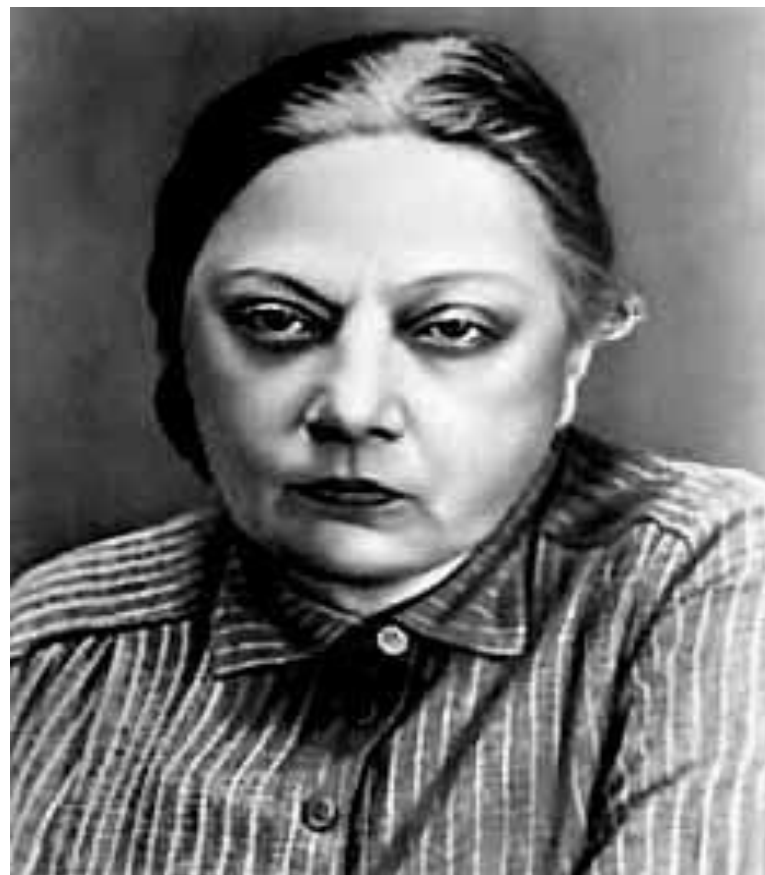
Надежда Константиновна Крупская (1869 - 1939)