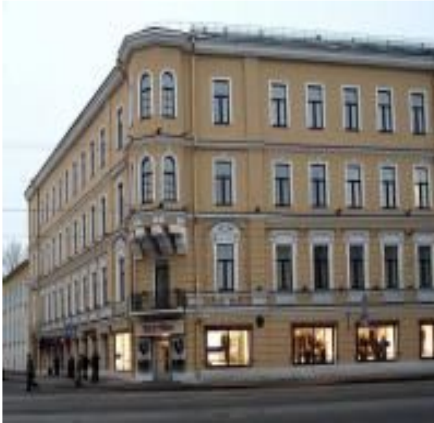
Здание школы им. Достоевского