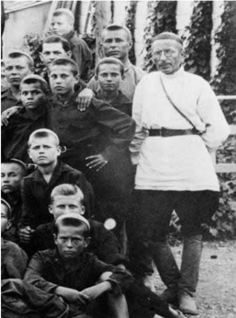
А.С. Макаренко и его воспитанники. Ялта. 1930