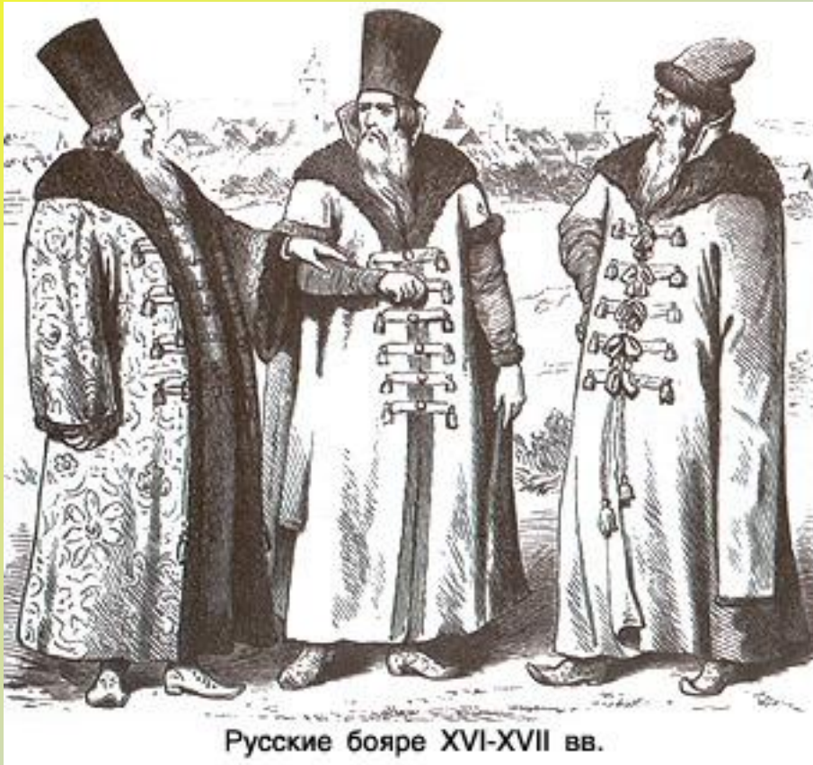
Русские бояре XVI-XVII вв.