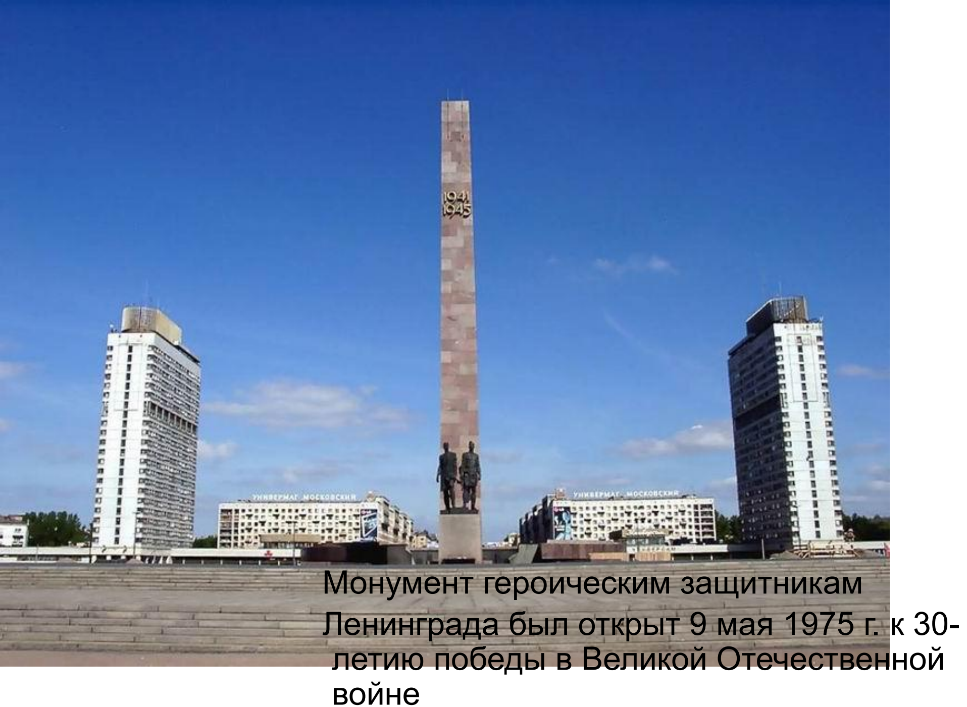
Монумент героическим защитникам Ленинграда был открыт 9 мая 1975 г. к 30-летию победы в Великой Отечественной войне