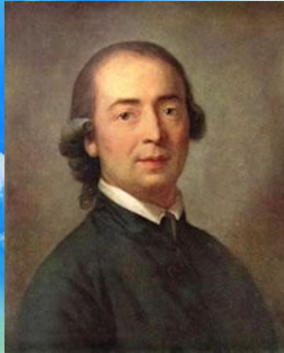
Гердер Иоганн Готфрид (25.8.1744 — 18.12.1803), немецкий философ, писатель-просветитель.