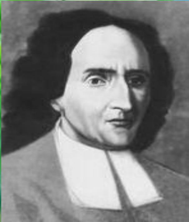
Вико Джамбаттиста (23.6.1668 — 21.1.1744), итальянский философ.

Понятие «культура» в его современном значении начало применяться в Европе в XVIII в. благодаря работам таких мыслителей, как Дж. Вико, И. Г. Гердер, Ш. Монтескье.