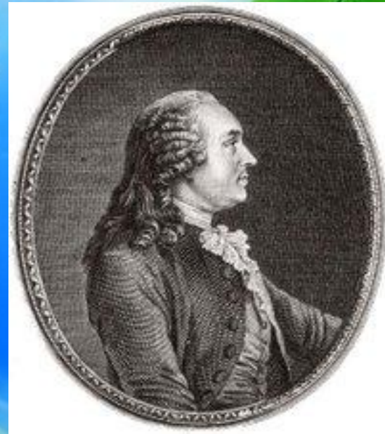
Анн Робер Жак Тюрго 10 мая 1727— 18 марта 1781)