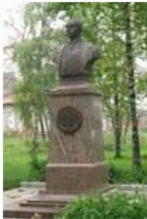
Бюст Н. Г. Кузнецова в Великом Устюге