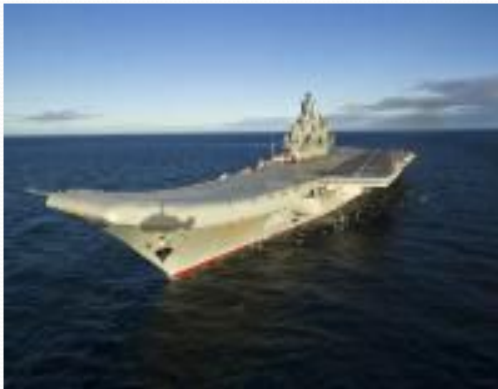
Тяжелый авианесущий крейсер "Адмирал Флота Советского Союза Кузнецов"