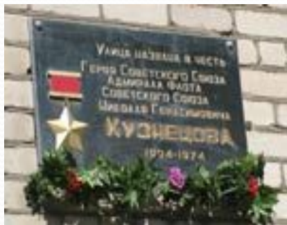
Мемориальная доска на ул. Кузнецова