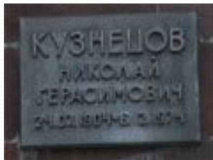
Мемориальная стена в городском парке