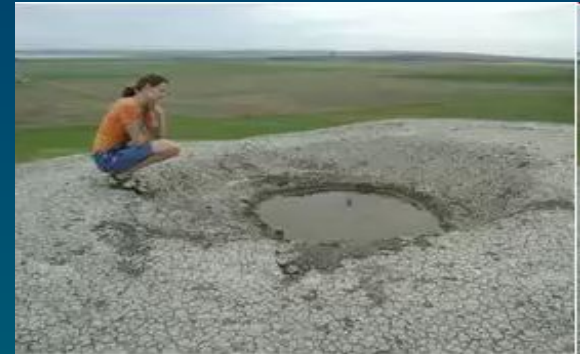
Кратер грязевого вулкана Ахтанизовская сопка