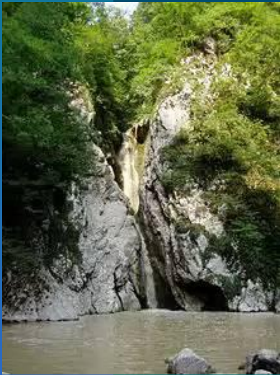
Нижний водопад реки Агуры