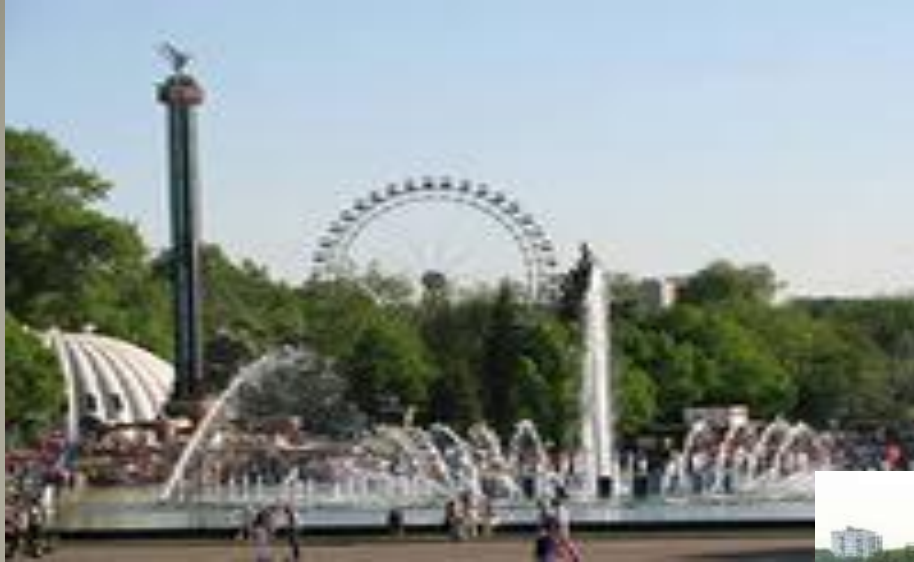
им. Горького Центральный парк