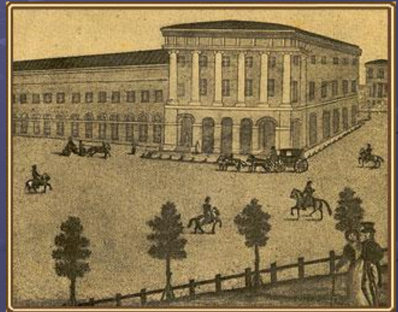
Дом купца Варгина, где открылся Малый театр в 1824 году