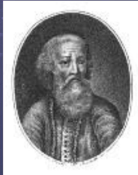
И.Розанов. Портрет основателя первого придворного театра Артамона Сергеевича Матвеева. 1801.