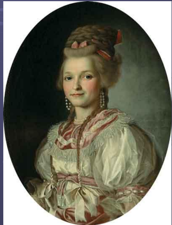
Танцовщица крепостного театра