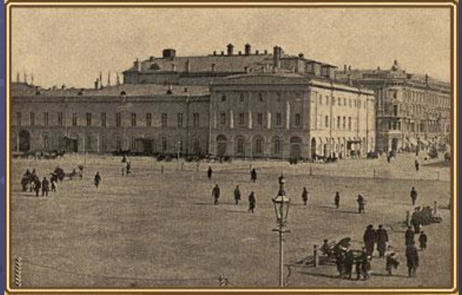
Здание Московского Малого театра, фотография 90-х годов XIX века