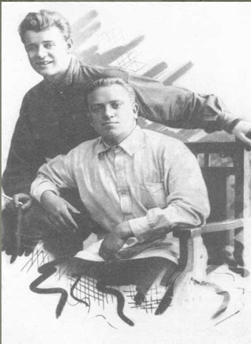
С.А. Есенин и П.И. Чагин.