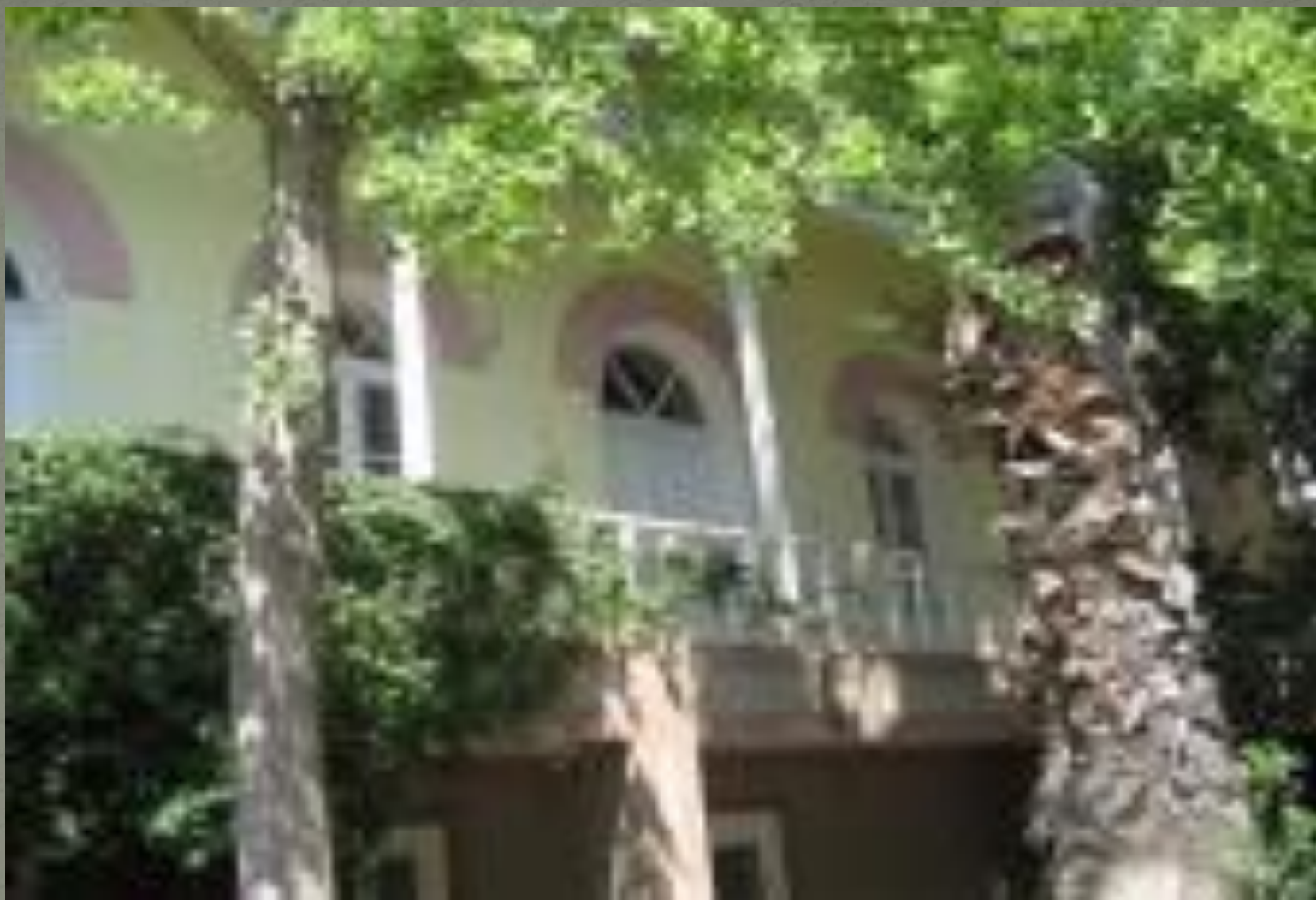
Резиденция нефтяного миллионера Муртузы Мухтарова