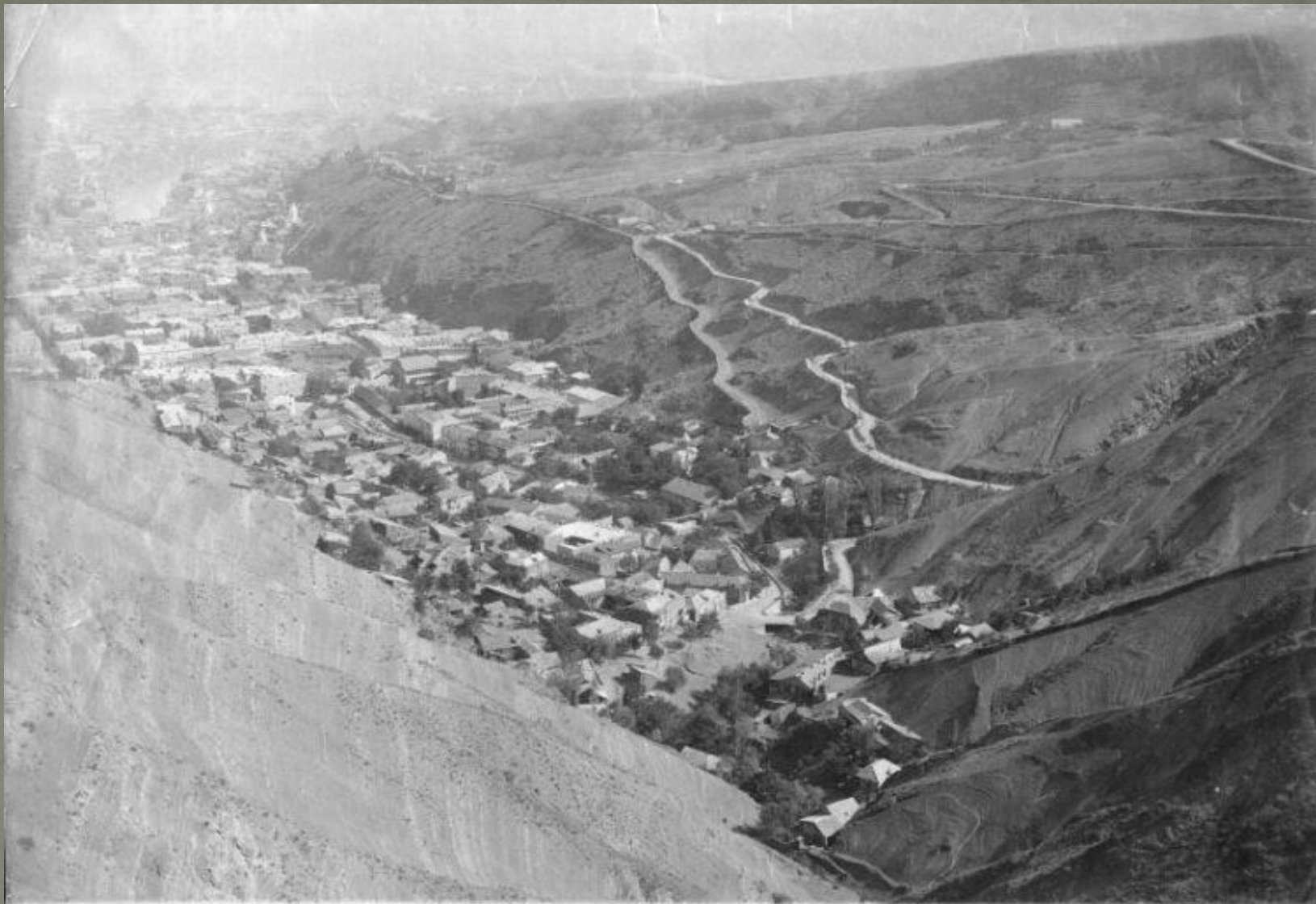
14132. Тифлис. Лощина Сололак, Старый город, адаларь и Навтаугъ. 535.