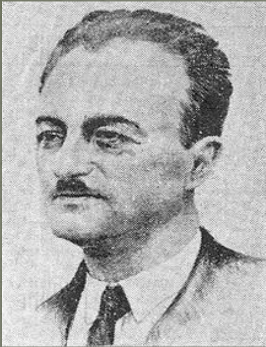
Паоло Яшвили (1895-1937) — грузинский поэт. Им была организована литературная группа поэтов-символистов «Голубые роги».