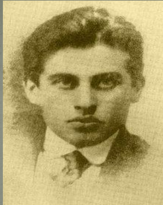
Тициан Юстинович Табидзе (1895—1937) — грузинский поэт, один из основателей литературного объединения «Голубые роги».