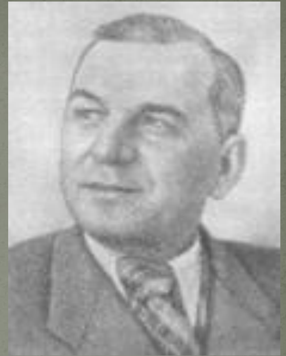
Георгий Николаевич Леонидзе (1899--1966) -- грузинский поэт и общественный деятель, входил в литературную группу "Голубые роги".