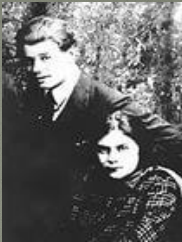
С. А. Есенин и С. А. Толстая-Есенина. Москва.