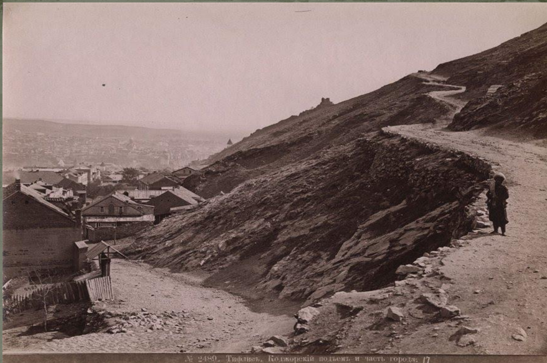
Тифлис, Коджорский подъем и часть города, 1917