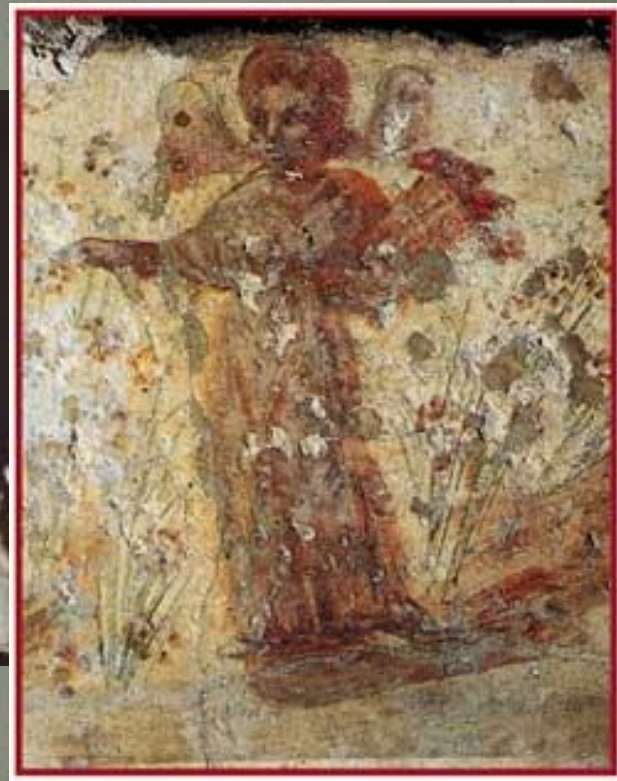
Психея (в греческой мифологии олицетворение души) с крыльями бабочки в небесном саду. Фреска. II век ДУША

Орфей отождествлялся с Иисусом Христом и с библейским царём Давидом-псалмопевцем.