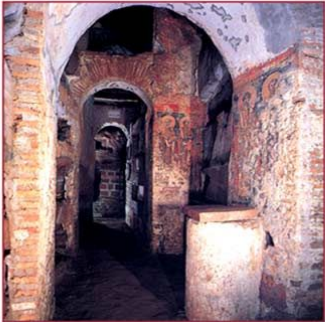
Крипта пап. Катакомбы св. Каллиста. III век. Рим

В ХУІв. В Риме случайно обнаружили подземные христианские кладбища II-IVвв., которые служили также убежищем и местом сбора христианской общины (их стали условно называть катакомбами, потому что одно из них находилось в местности Катакумб).