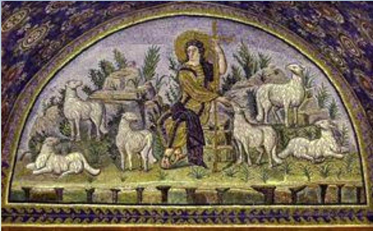
Добрый Пастырь Равенна Vв.