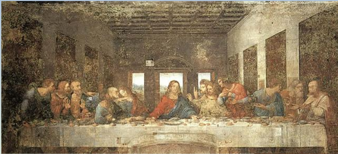
Леонардо да Винчи