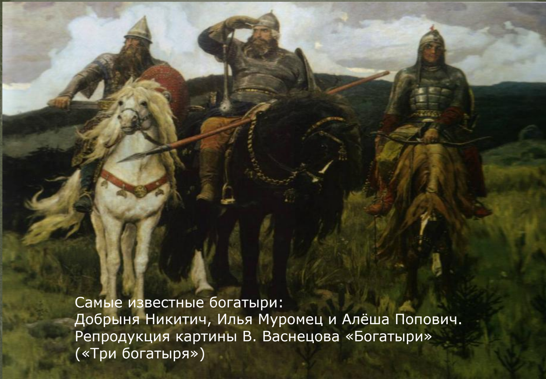
Самые известные богатыри: Добрыня Никитич, Илья Муромец и Алёша Попович. Репродукция картины В. Васнецова «Богатыри» («Три богатыря»)