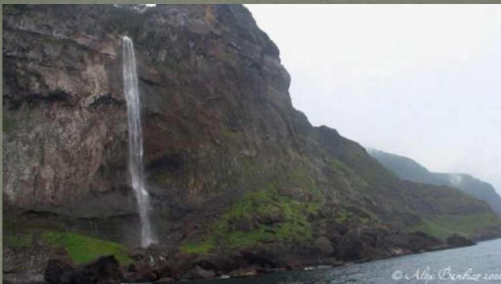
Водопад России Илья Муромец

Остров Муромец — ландшафтный парк и любимое место отдыха горожан