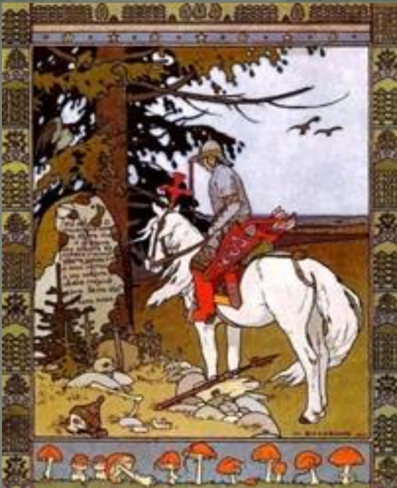
И. Билибина «Витязь на распутье»