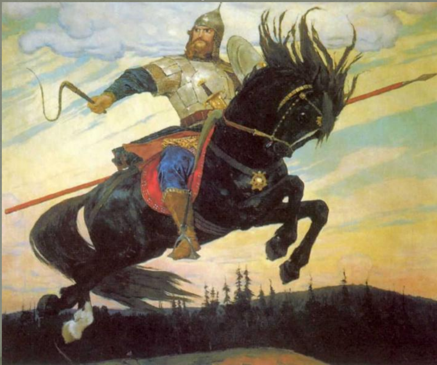
Картина В. Васнецова «Богатырский скак», 1914