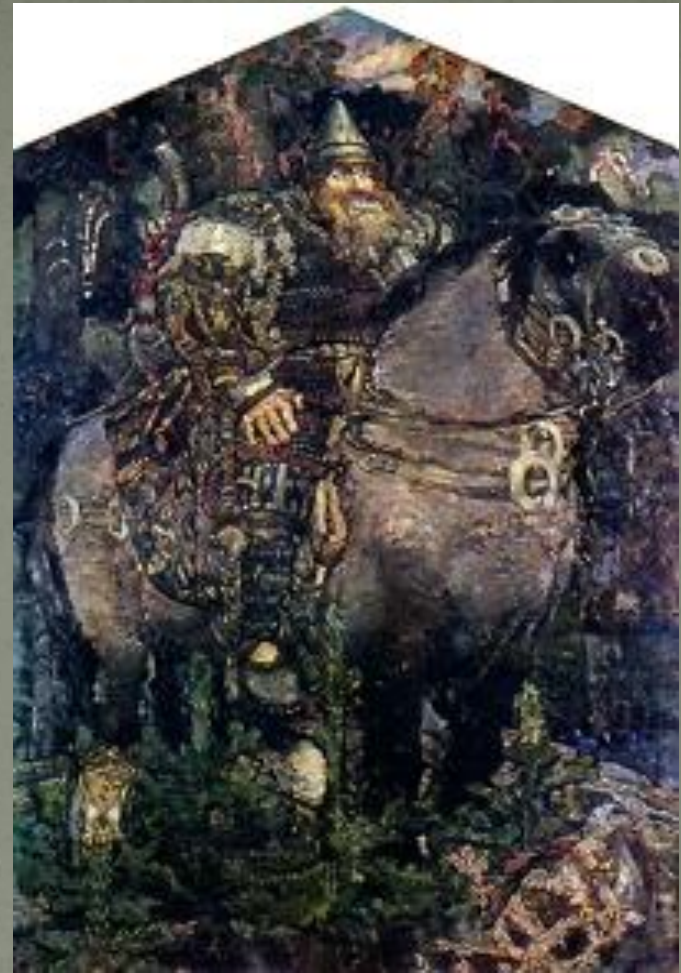
Репродукция с картины М. Врубеля «Богатырь»