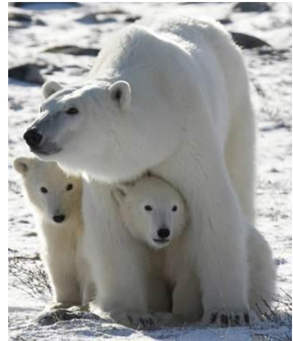
Белая медведица с детёнышами