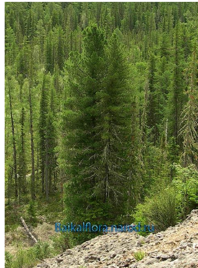
Сосна сибирская кедровая