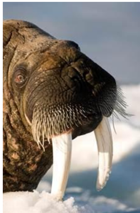
Вибриссы на морде моржа

Бивни моржа – универсальное орудие в добыче пищи и оружие при обороне от врага, а также знак отличия (у кого самые большие и мощные бивни, тот и главный). На морде моржа есть густые усы – вибриссы – с помощью которых они отыскивают пищу на дне моря.