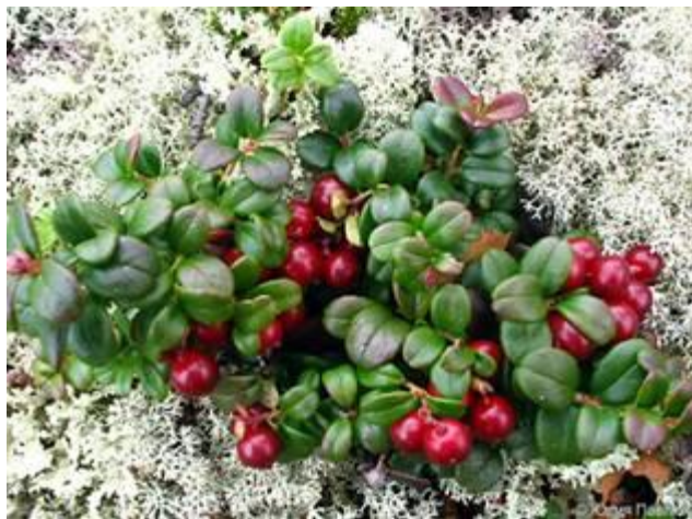
Брусника и ягель