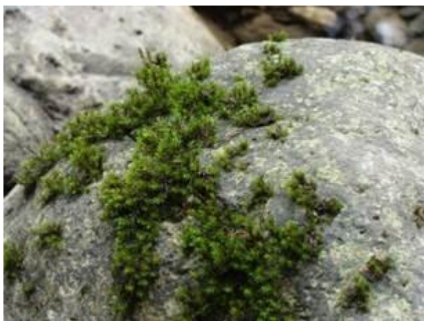
Мхи на камне