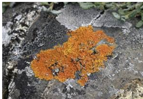
Лишайники на камне