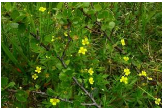
Береза и травы в тундре