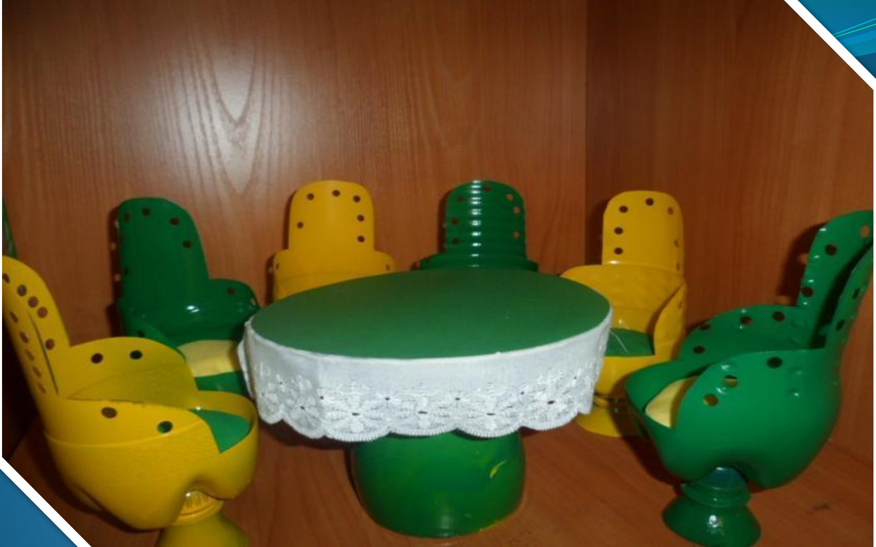
Мебель для столовой в кукольный домик