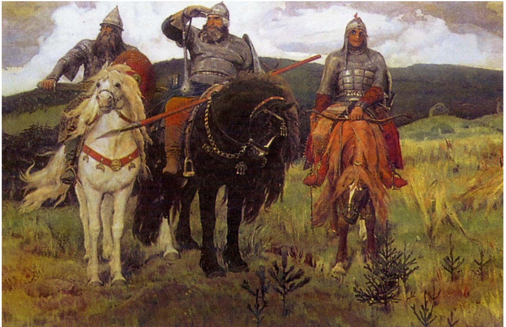
« Богатыри » (1898, Государственная Третьяковская галерея) Центральным произведением стал большой холст «Богатыри», изображающий трех былинных героев- величественного Илью Муромца, порывистого, гневного Добрыню Никитича и простоватого Алёшу Поповича- на заставе, высматривающих врага.