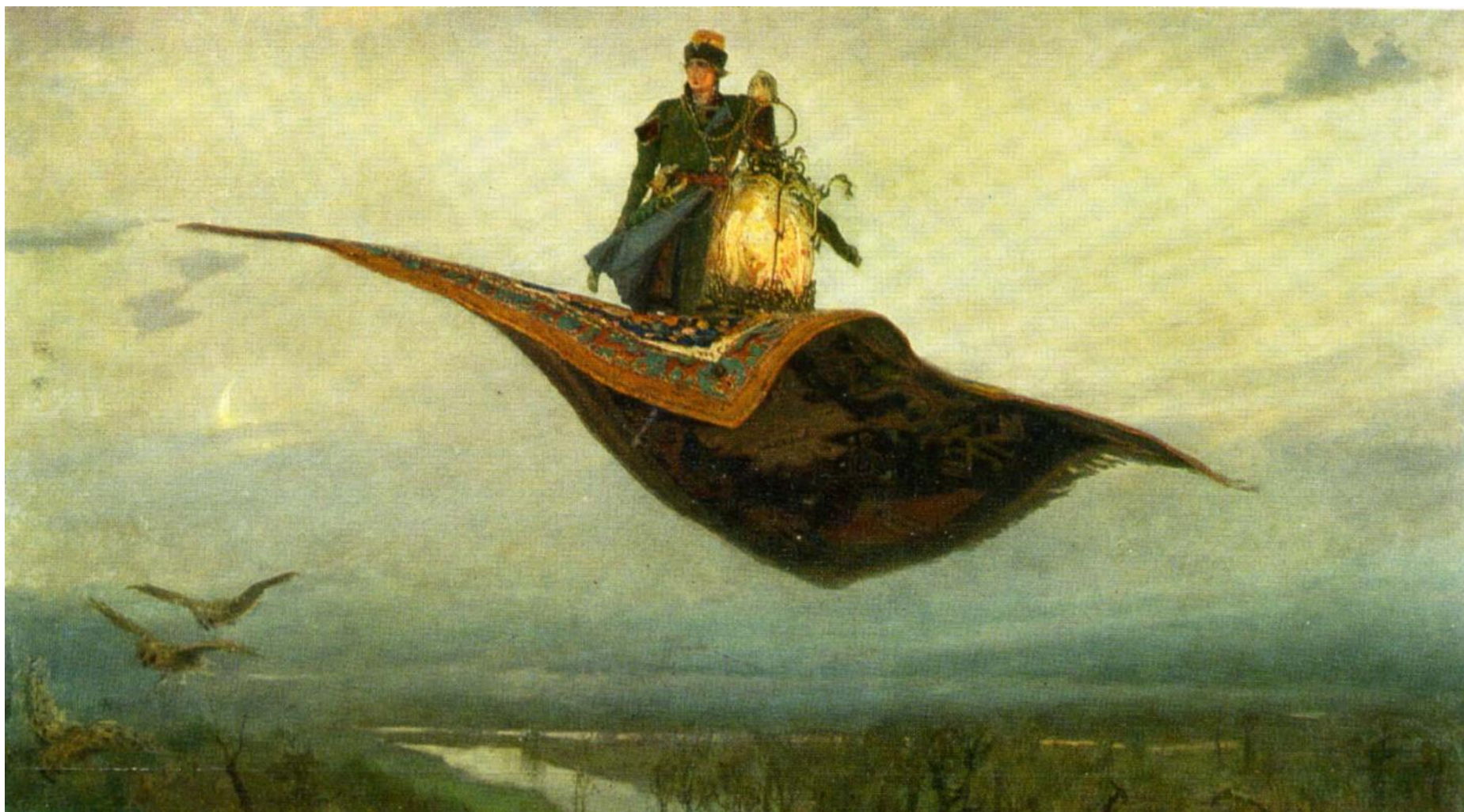
«Ковёр-самолёт» (1830, Нижегородский художественный музей)