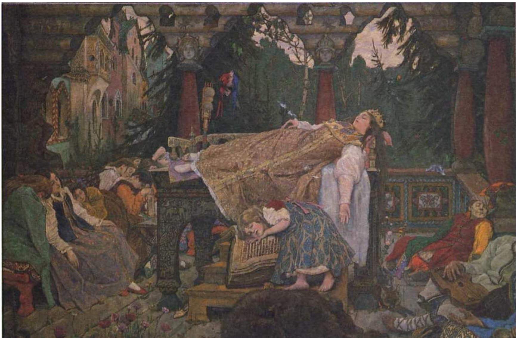
«Спящая царевна» (фрагмент)