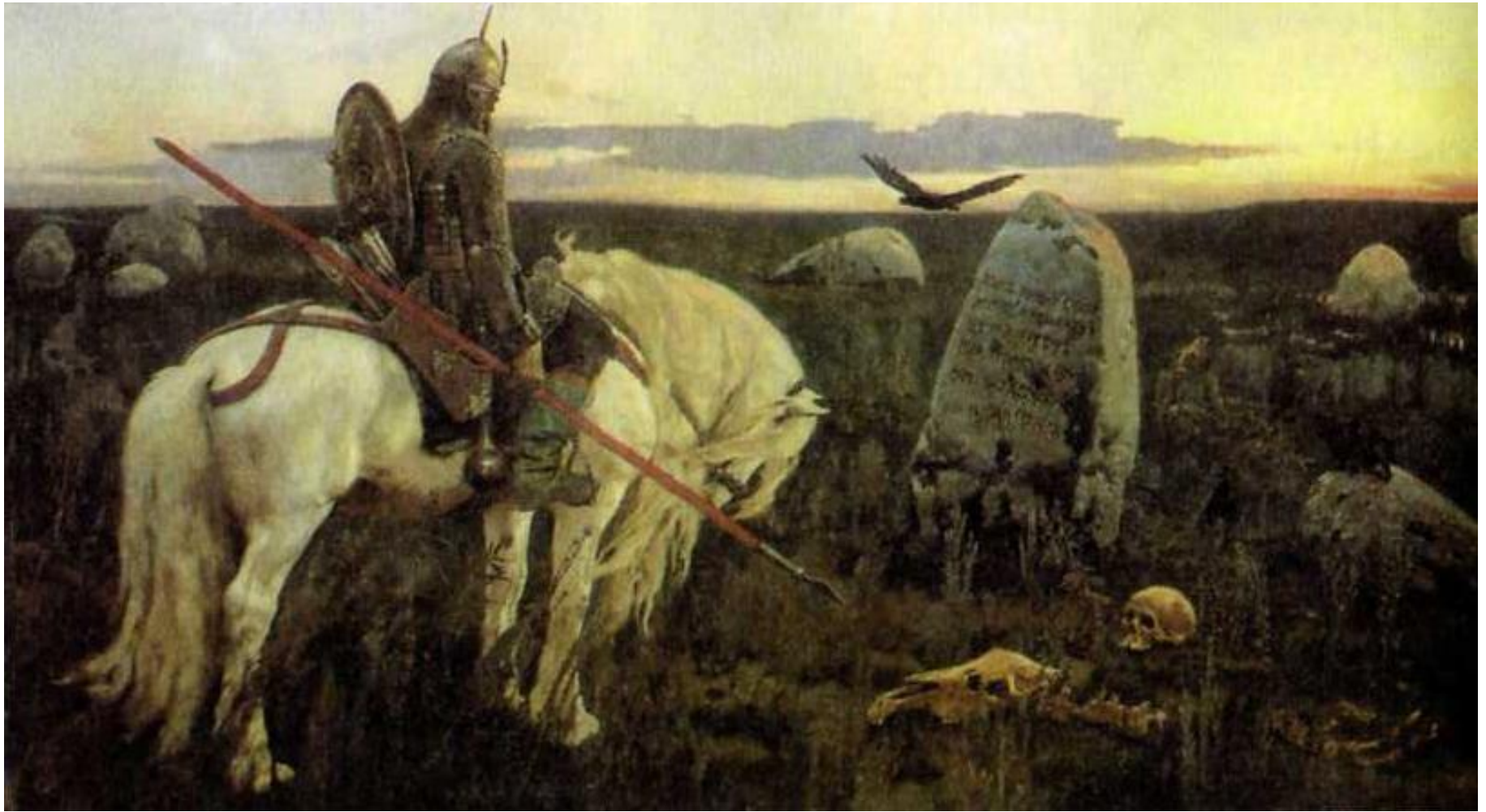
«Витязь на распутье»