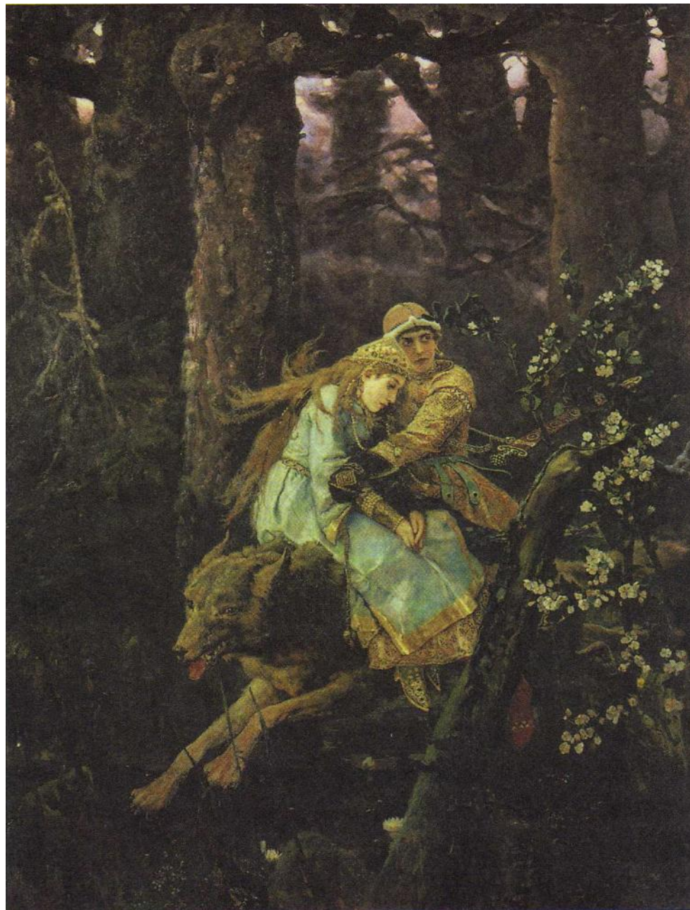
«Иван-царевич на Сером Волке»