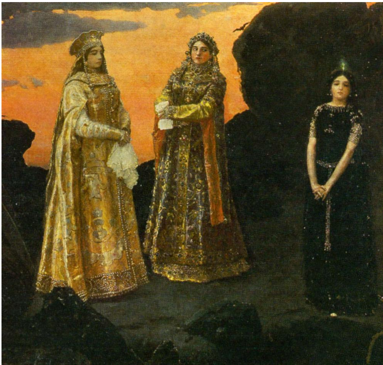
«Три царевны подземного царства» (1879 ГТГ, 1884 Киевский музей русского искусства)