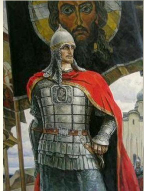
Кантата «Александр Невский»