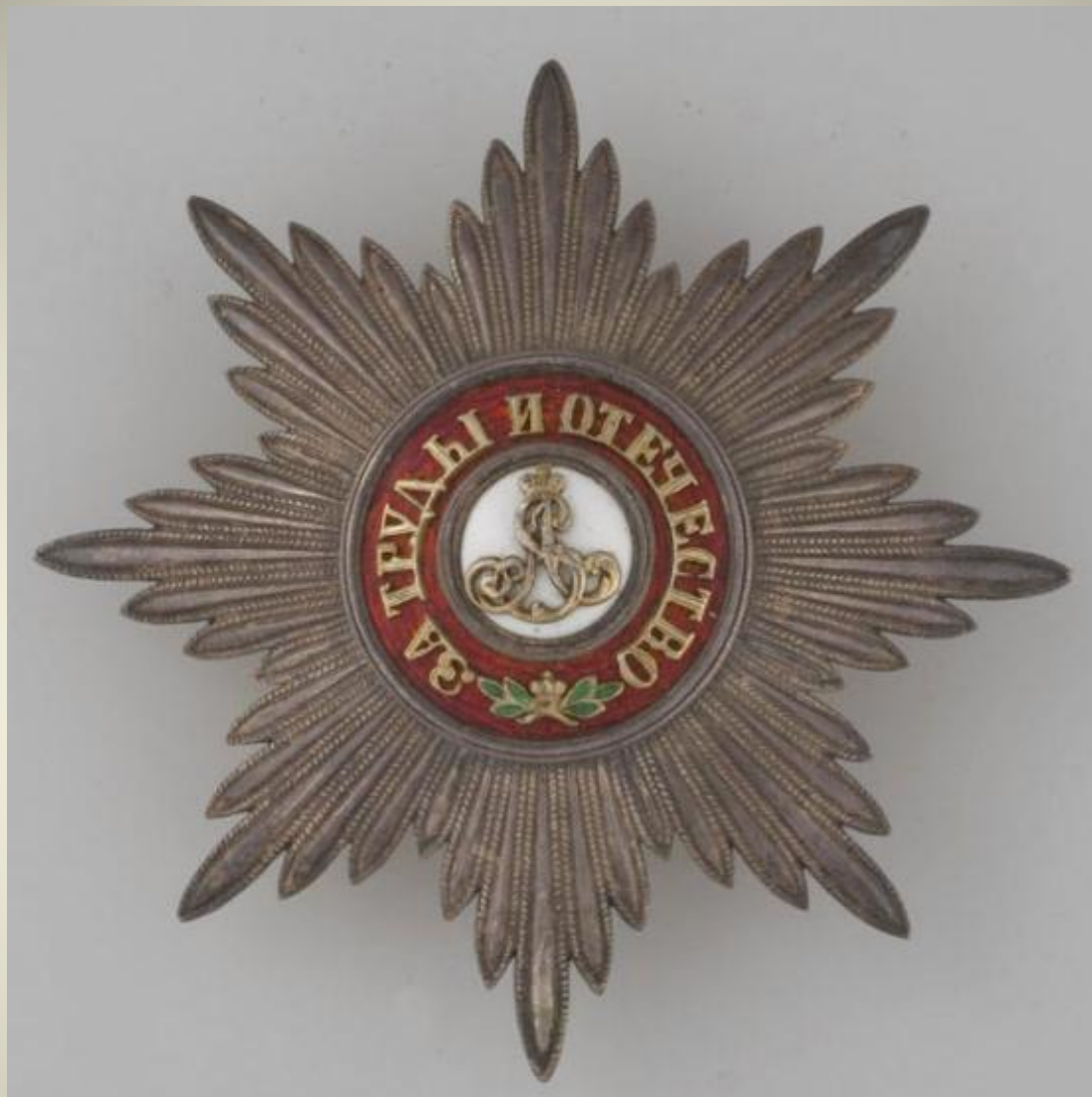
Звезда к ордену Святого Александра Невского